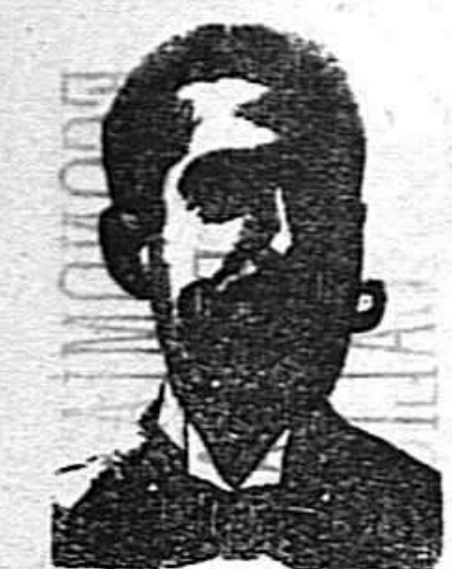
A. SALVATI COSTANZI Calle Diputación, 465 - Barcelona