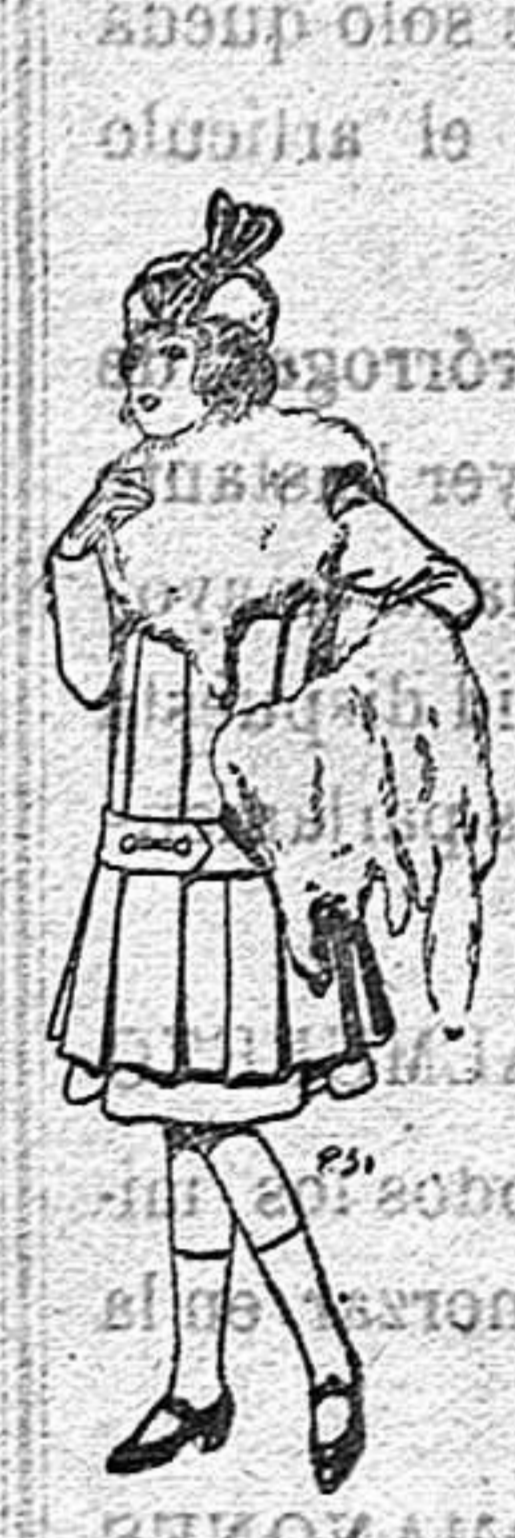
Paletor de lana para jóvenes De 13 a 16 años De 12-50 a 20 ptas. Juego de pieles para niñas A 15 ptas.