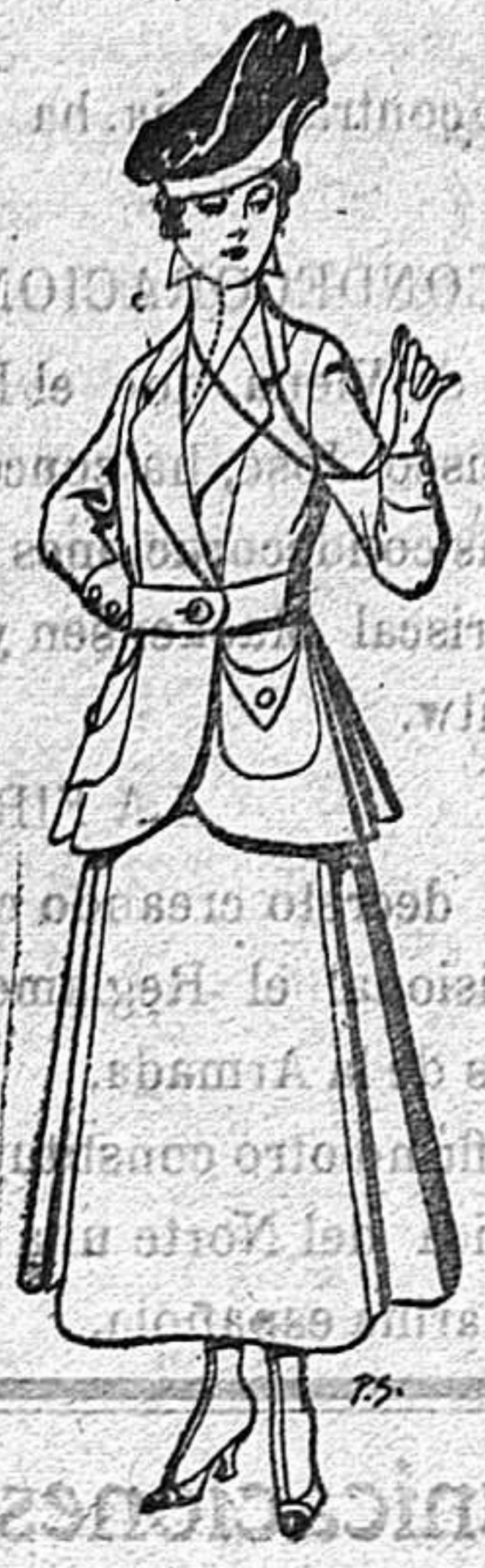
Trajes de lana negra, azul y color para señora De 50 a 55 ptas