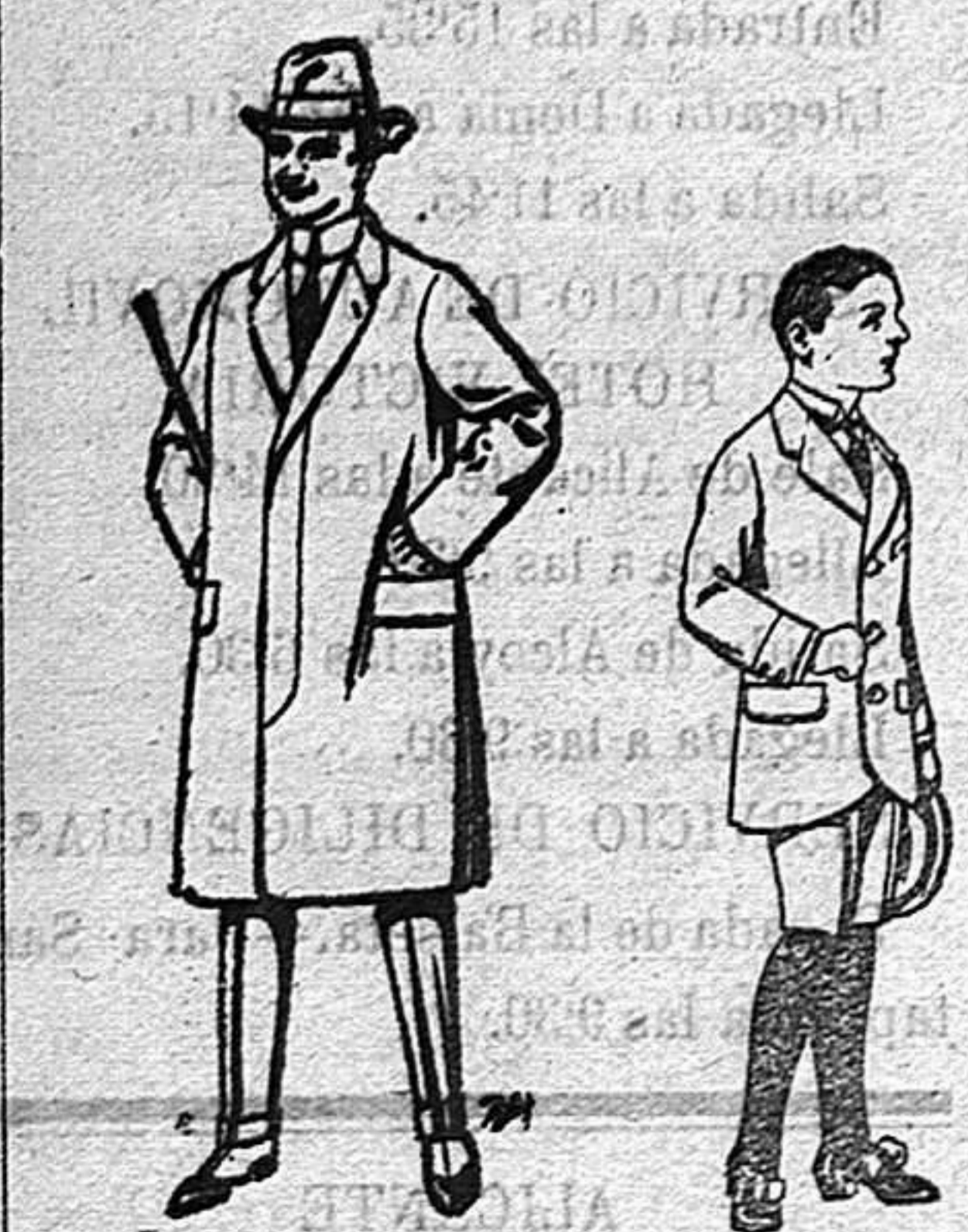
Gabanes de lana vionia o melton para niños de 10 a 16 años De 20 a 56 ptas. Trajes de paten para niños de 7 a 12 años De 16 a 40 ptas