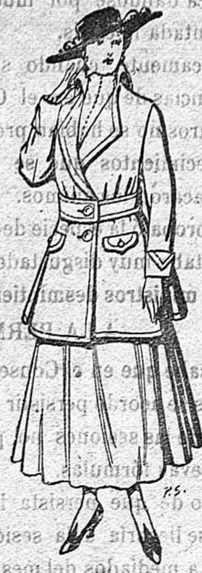
Abrigos de patén gran novedad para señora De 26 a 40 ptas