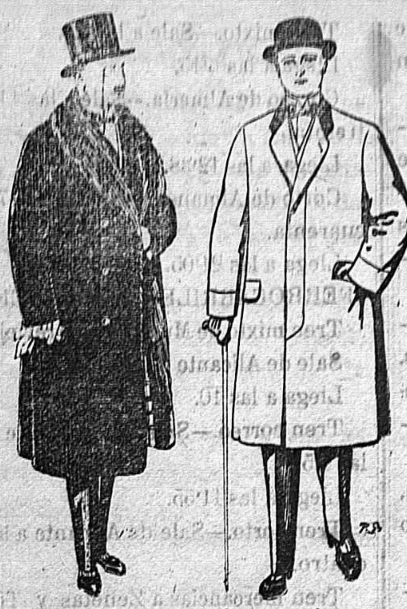
Gabanes de edredón negro forro seda cuello y vistas de piel A 125 y 135 ptas. Gabanes de paten melton o cheviot De 25 a 100 ptas.

Peletería, Camisería, Géneros de Punto, Corbatería, Guantería, Sombrerería, Zapatería, Paraguas, Bastones y Artículos de Viaje.