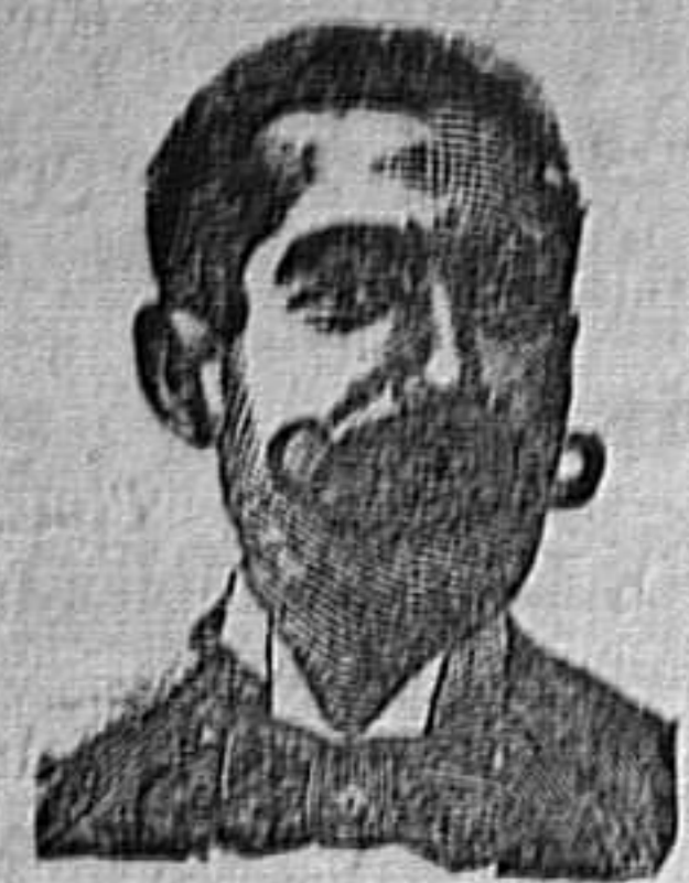
A. SALVATI COSTANZI Calle Diputación, 435.-Barcelona