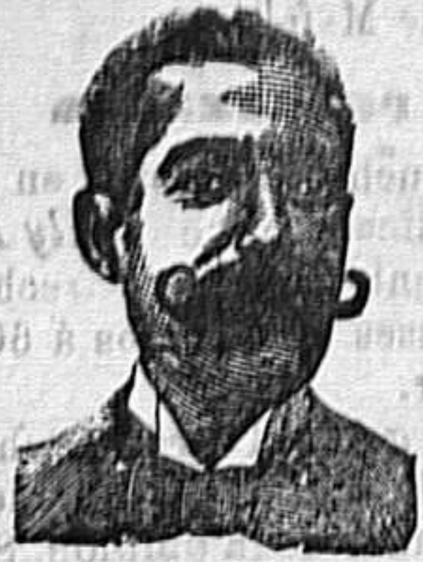
A. SALVATI COSTANZI Calle Diputación, 435.-Barcelona