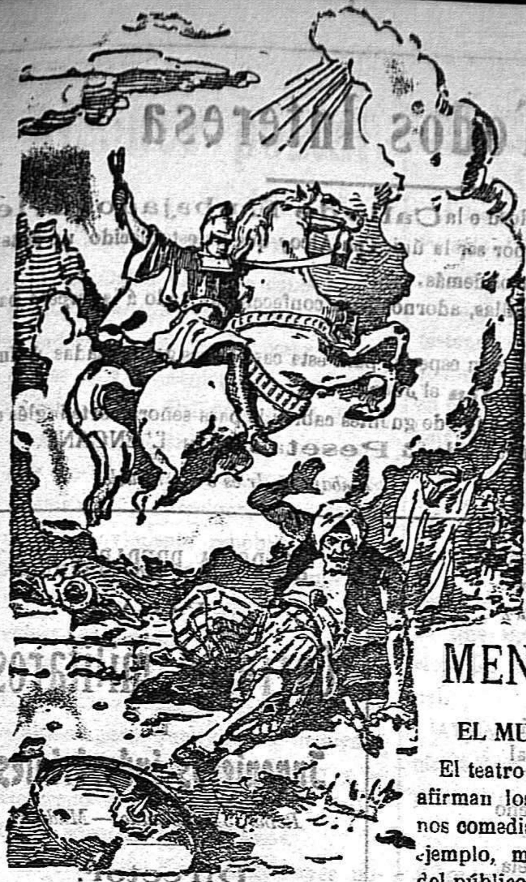
Juicio Martí, San Jorge!

Redacción y Administración Calle Pintor Casanova N.º 24