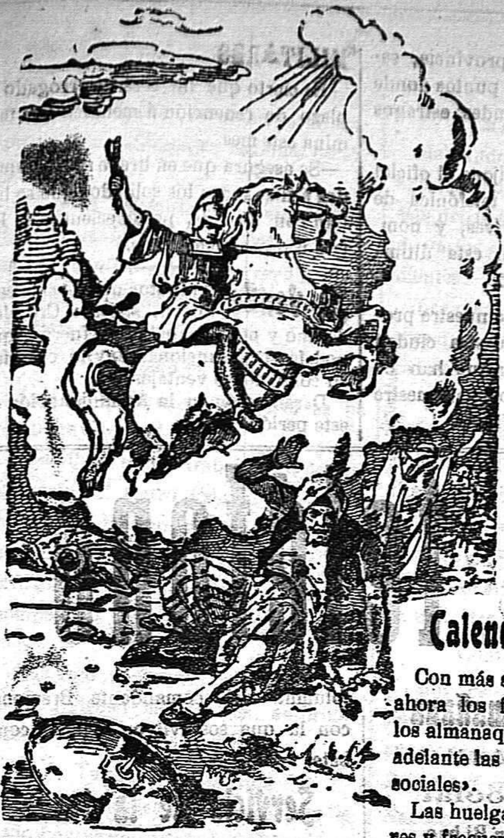
Juicio a San Jorge Defensa del pueblo de Dios

Precios de suscripción Aleoy al mes . . . . . 150 Ptas. Para los obreros al mes . 075 Ptas. Fuera al trimestre . . . . 450 Ptas. Número atrasado . . . . . 015 Ptas.