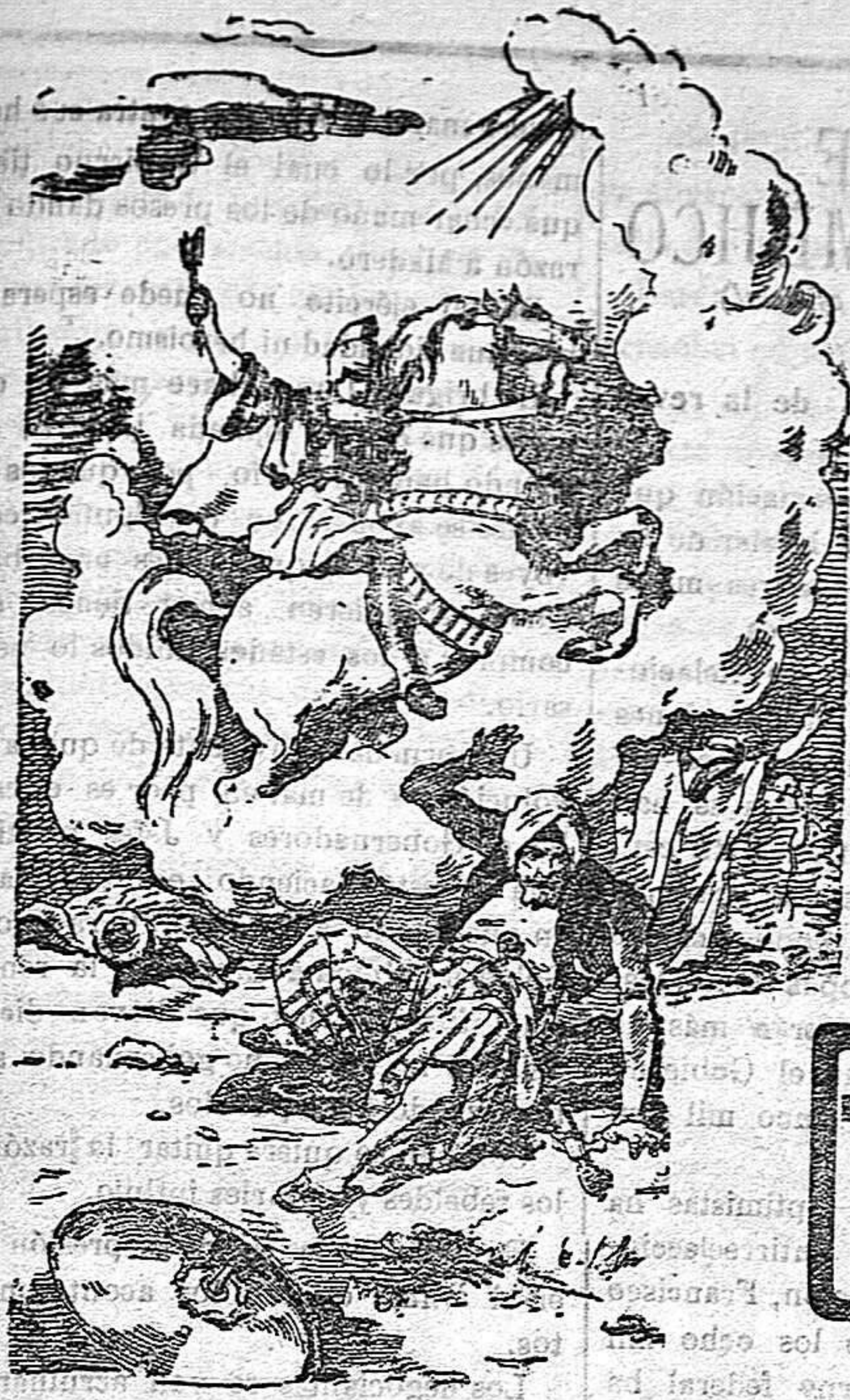
¡Juicio Mártir San Jorge! Veni in adiutorium populo Dei. Defiende al pueblo de Dios.

Precios de suscripción Alcoy al mes . . . . . 1'50 Ptas. Para los obreros al mes . . . . . 6'75 Ptas. Fuera al trimestre . . . . . 4'50 Ptas. Número atrasado . . . . . 6'15 Ptas.