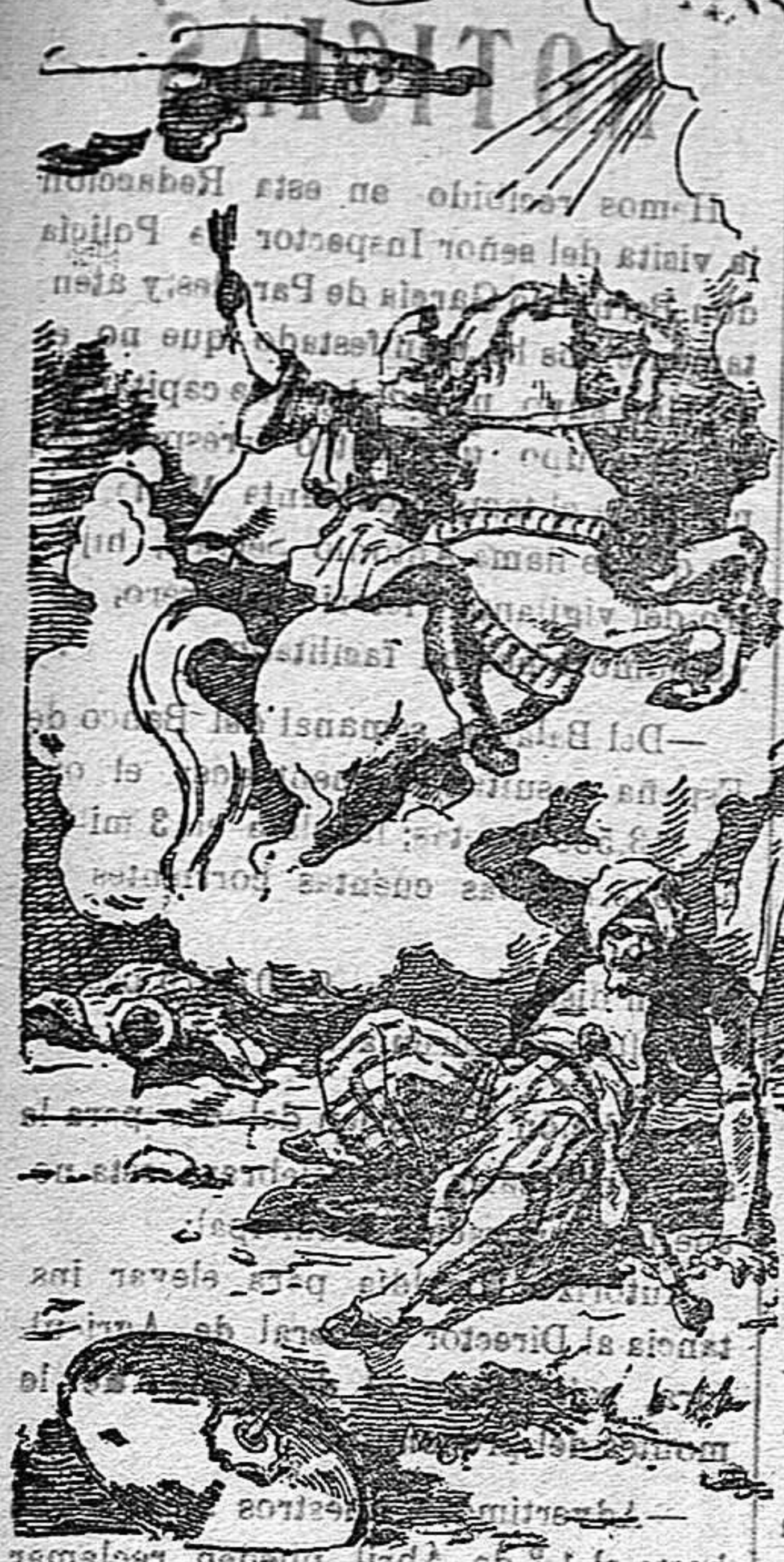
Juicio. Mártir San Jorge! Venir en adelante. Defiende al pueblo de Dios.

El viajante de esta importante casa se encuentra en el Hotel Continental Enseñará el extenso muestrario que lleva a su numerosa y distinguida clientela