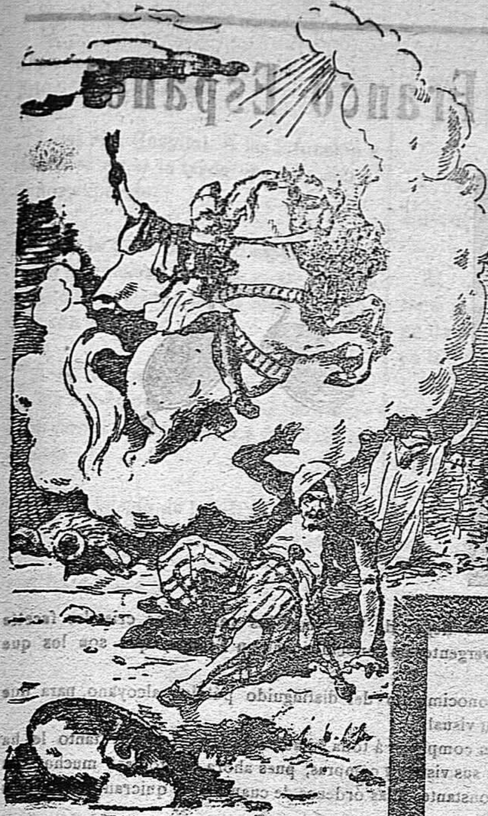
Juicio-Mártir San Jorge Defiende al pueblo de Dios

Redacción y Administración Calle Pintor Casanova N.º 24