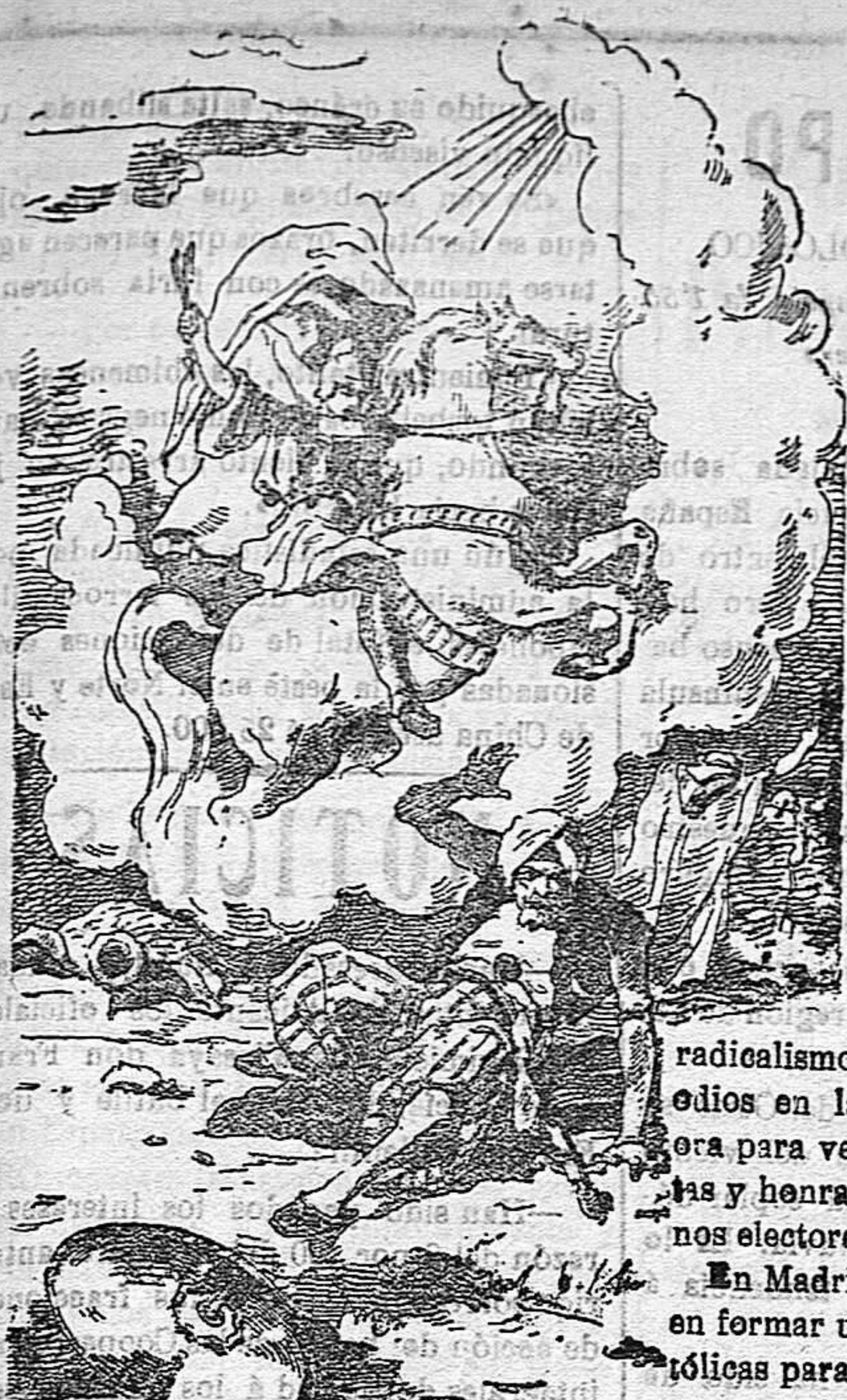
¡Juicio Mártir San Jorge! Veni in adiutorium meum. Offic. eccles.