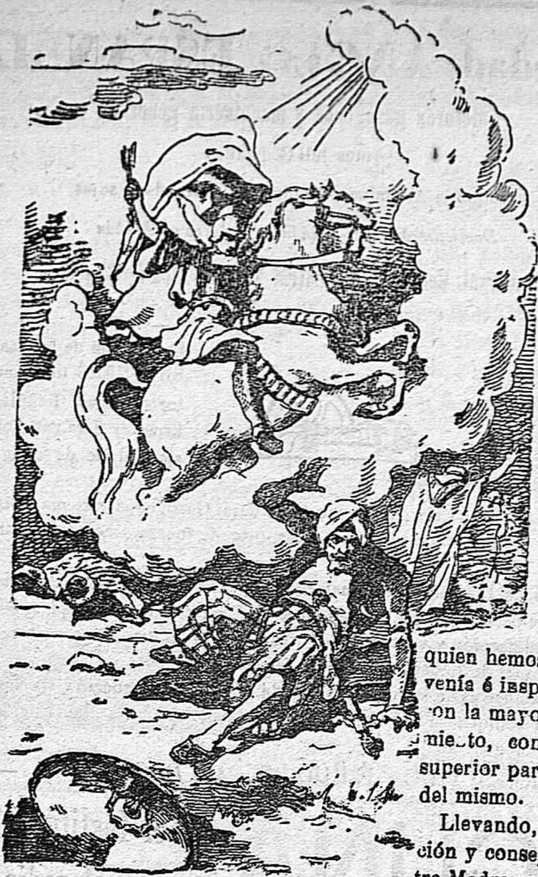
¡Juicio Mártir San Jorge! Veni in adiutorium. Populo Dei. Offici eccles.

Precios de suscripción Alcoy al mes . . . . . 1'50 Ptas. Para los obreros al mes . 0'75 Ptas. Fuera al trimestre . . . . . 4'50 Ptas. Número atrasado . . . . . 0'15 Ptas.