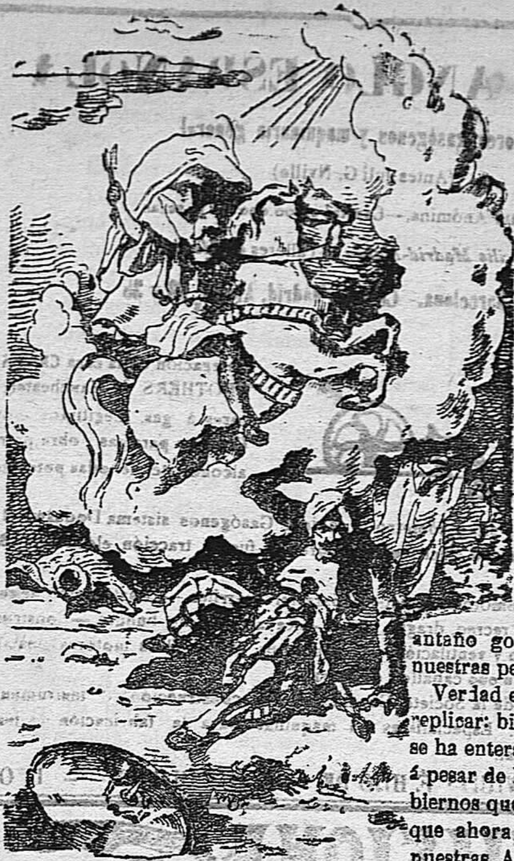
Juicio Mártir San Jorge!

Redacción y Administración Calle Pintor Casanova N.º 24