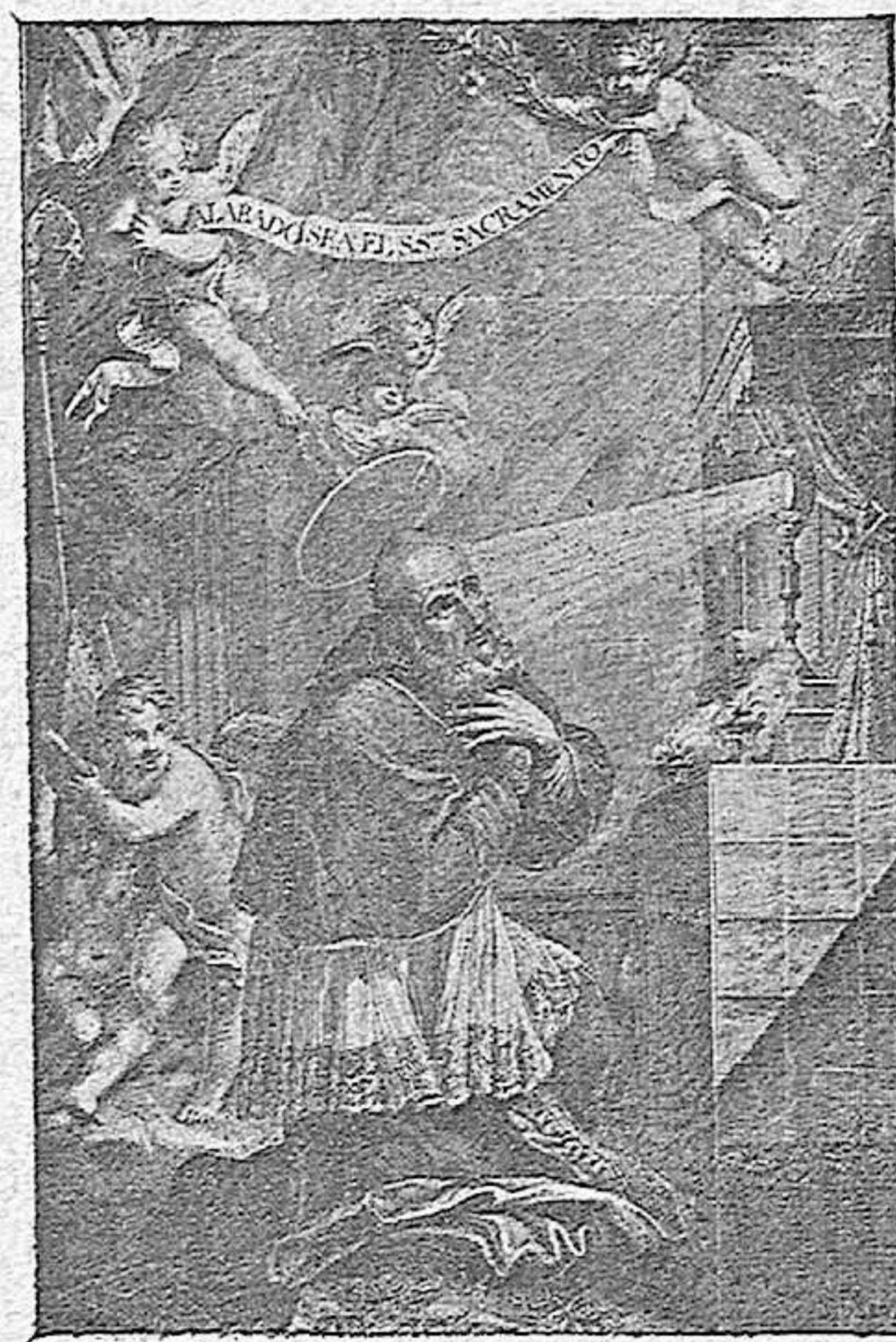
EL BEATO JUAN DE RIBERA