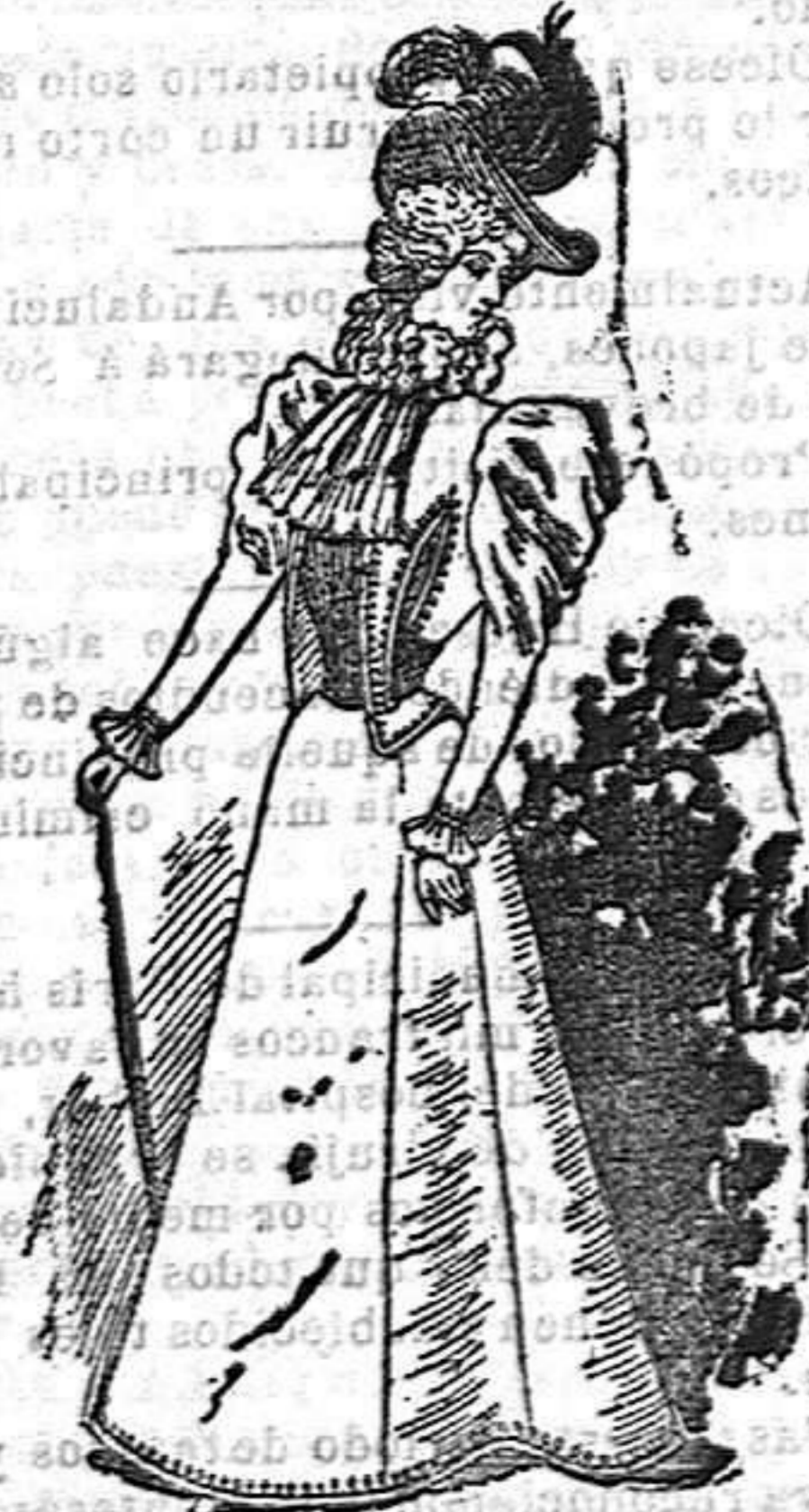
Vestido para primavera

De pañete gris, abierta en las pinzas y delantero, sobre un cuerpo de pañete blanco, de cuya tela son también las solapas; al rededor de éstas va un guipur, con trefcilla moaré en el borde de la chaqueta. Mangas al bias con volante de tal blanco y corbata de lo mismo.