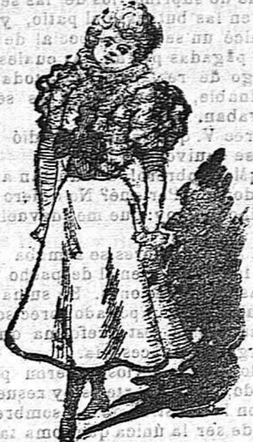
Vestido para niña de 7 años

De surah gris y faille, color ciruela: cuerpo fofo en el talle con torera de faille; arrugado en el delantero con un lazo. Cuello alto y ruxa de faille; mangas estrechas con un bollo arrugado en el centro y volante de encaje en el borde.