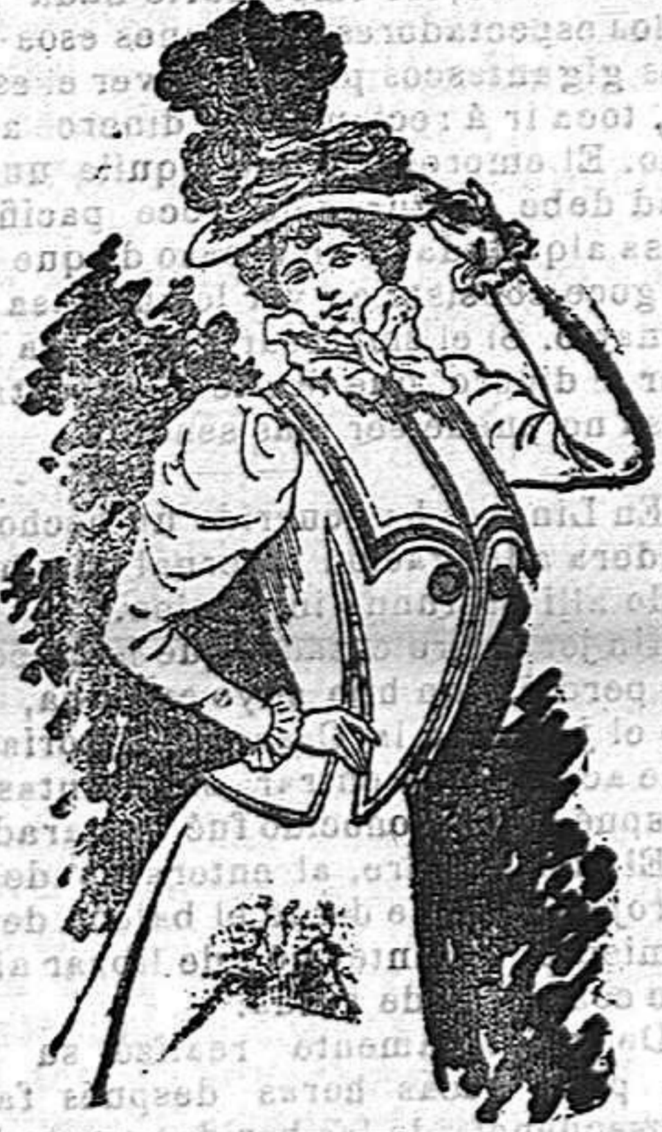
Chaqueta para primavera

Falda también de surah en forma de campana.