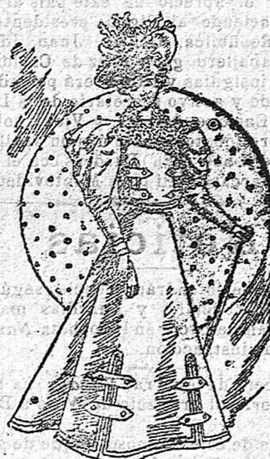
Traje para campo

De lana sargel cuerpo ajustado y abrochado de lazo del brazo; delantero, en forma torera, cubierto de de encaje con dos tiras de cinta de raso alrededor; cintitas del número cero alrededor del talle, formando conset y abrochados al lado, con chús . Cuello alto con una ruxa de gasa; manga estrecha, cubierta de encaje, acampanada la bocamanga con bollo partido y recogido en el hombro; falda lisa forma campana.