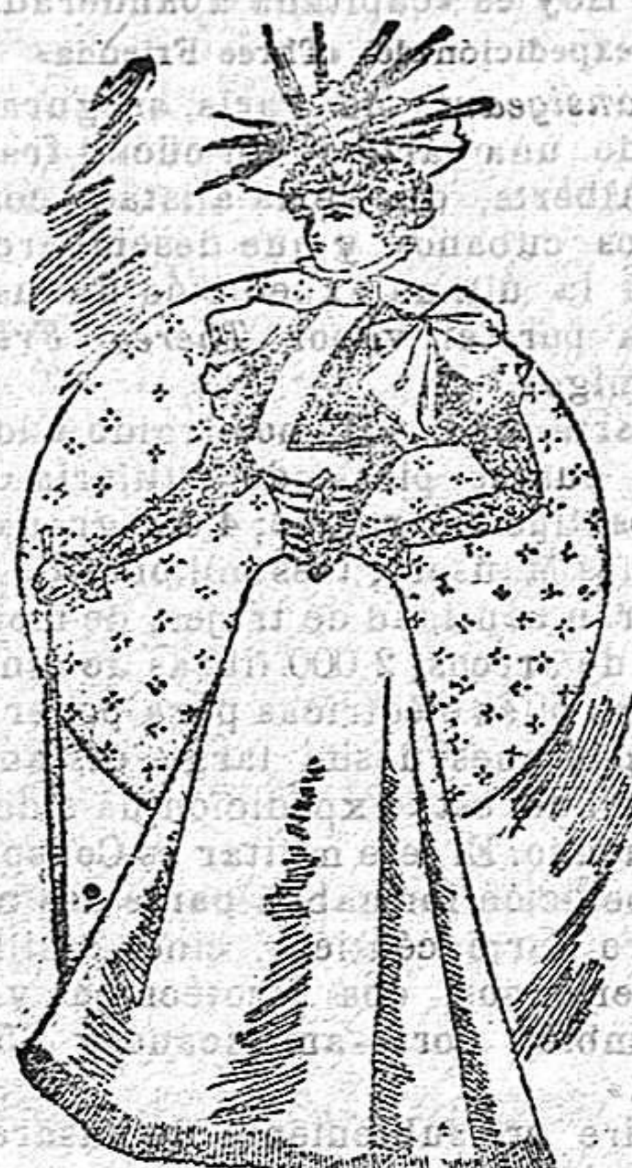
Traje para señorita

De lana sargel cuerpo ajustado y abrochado de lazo del brazo; delantero, en forma torera, cubierto de de encaje con dos tiras de cinta de raso alrededor; cintitas del número cero alrededor del talle, formando conset y abrochados al lado, con chús . Cuello alto con una ruxa de gasa; manga estrecha, cubierta de encaje, acampanada la bocamanga con bollo partido y recogido en el hombro; falda lisa forma campana.