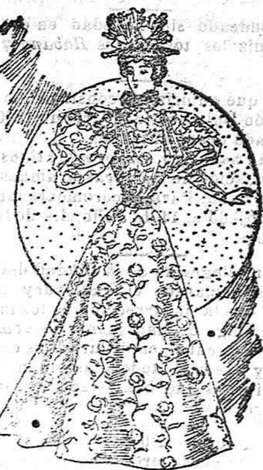
Traje de señora joven, para paseo

De alpaca, corte sastrero; chaqueta cruzada sin costuras en la espalda, floja en el delantero y corta hasta el talle; va abierto en el mismo delantero con pespuntos y cuatro patas con pequeños botones; grandes solapas y cuello, cubiertos de encaje; manga de una pieza con patitas en la bocamanga. Falda, forma campana, con pespuntos y dos aberturas en el delantero, con patas y botones iguales a los del cuerpo.