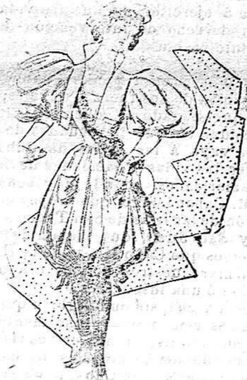
Traje disfraz.—Cocinera moderna.

El pantalón y el cuerpo son de una sola pieza, el pantalón hasta la rodilla y el cuerpo escotado, bordando ambas piezas de lentejuelas doradas. Las mangas son también de raso, una encarnada y otra verde, cortas hasta el codo, terminadas en un volante plegado en acordeón. Gran cuello también plegado que termina debajo de los brazos. Sombrero de raso blanco forma clown propio para este traje, una mariposa de raso verde y encarnado bordada de lentejuelas. Medias de seda negra y zapatos escotados de charol.