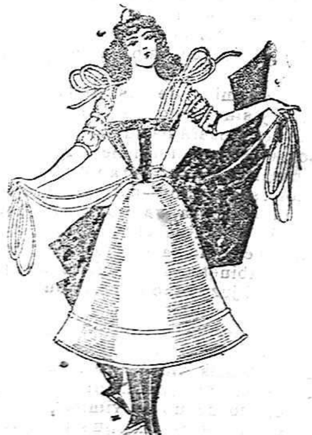
Traje disfraz.—De campana.

La chaquetilla es de raso, del mismo género que lo demás, forma bolera, abierta y con cuello alto y mangas forma globo cortas hasta los codos, cerrando con un brazalete también de raso que se abrocha con un botón. Boina blanca, de raso, con un aroma en el centro; medias de seda negra y zapatos de charol con hebilla. En el delantero de la falda van dos bolsillos, lo mismo que en la chaquetilla.