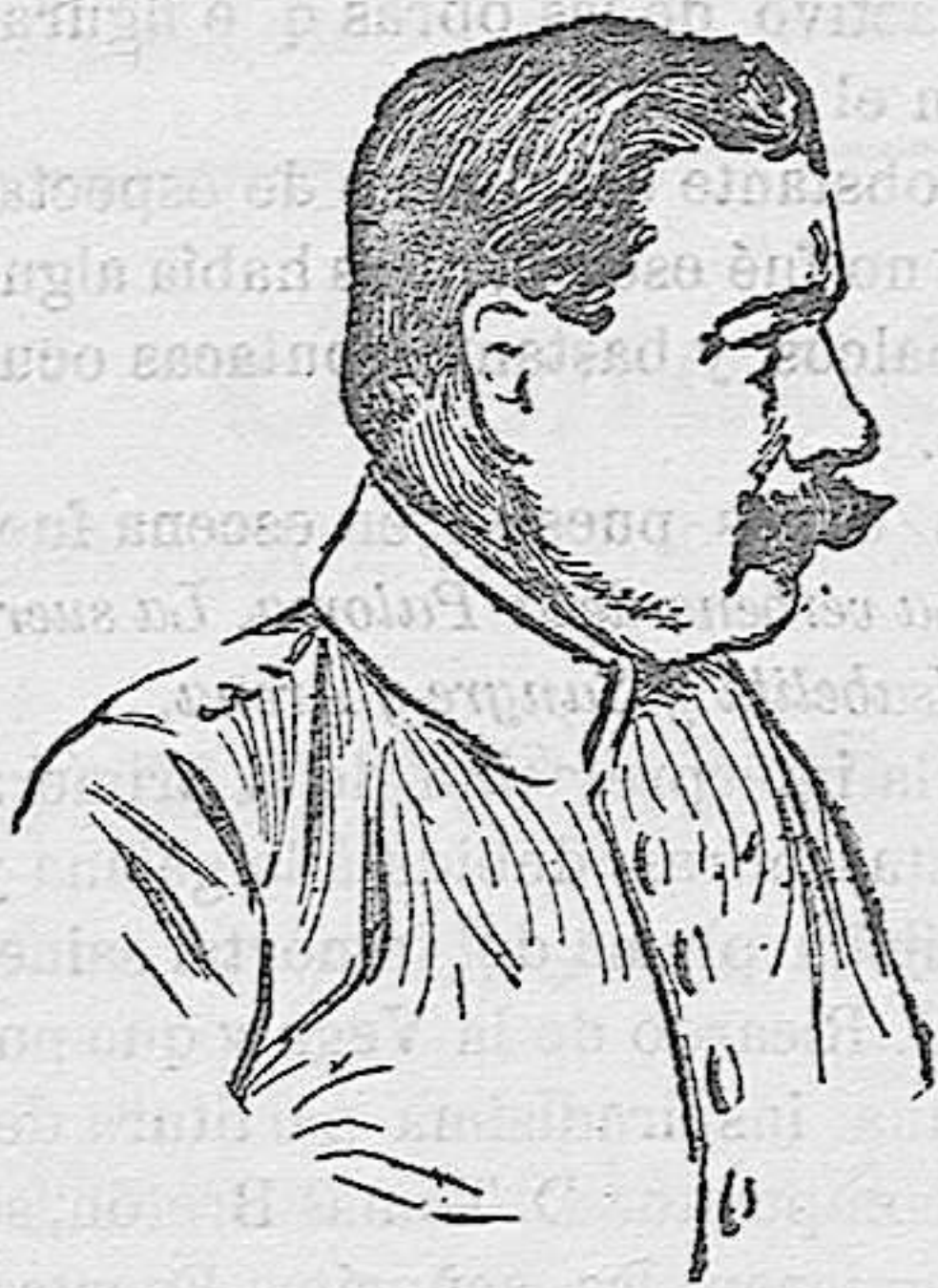
Ascendido á coronel como recompensa especial por los relevantes servicios prestados á la patria al frente de las fuerzas españolas de Alcázar y Larache.