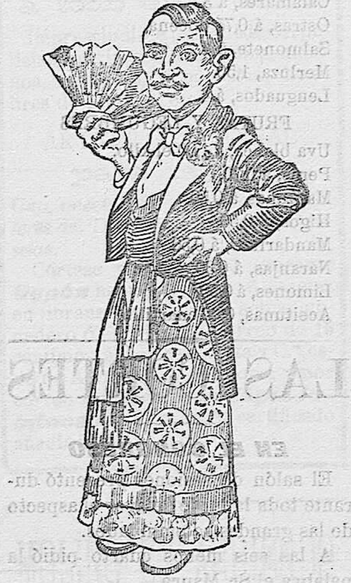
EL DR. SUN-YAT-SEN Presidente de la República china.