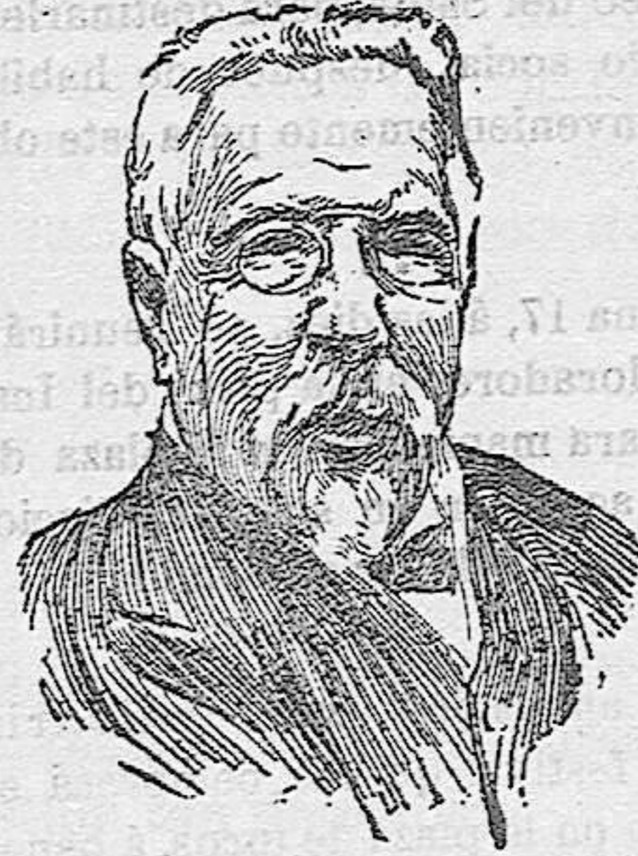
DON MANUEL MURGUIA

El día 17 cumple el octogésimo aniversario de su natalicio un gallego ilustre: el historiador y cronista del país galaico, D. Manuel Murguía, cuyo nombre no puede por menos de traer á la mente el de otra gloria de Galicia: el de la poetisa Rosalía de Castro, de quien fué esposo. Galicia entera dará en ese día al escritor ilustre un testimonio de admiración y afecto.