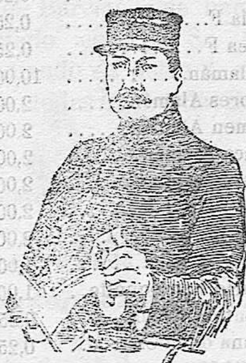
EL TENIENTE MENARD

La expedición se realizará bajo el patronato y á expensas del Gobierno francés, y el jefe de ella será Mr. de Payer, apellido glorioso en los anales de las exploraciones árticas.