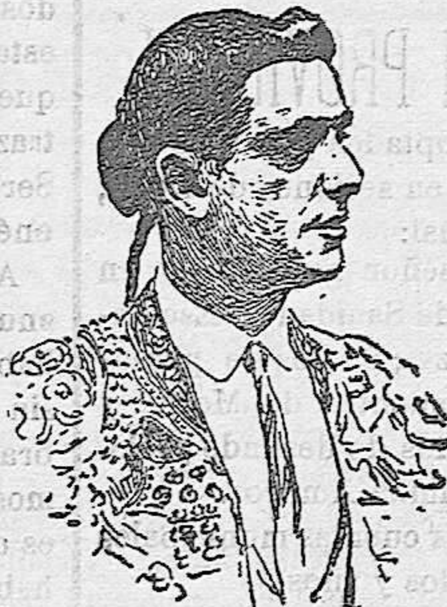
RAFAEL GONZALEZ (Machaquito)

Durante el mes de Septiembre se registraron nueve altas y seis bajas; quedando á fines del mes último 30 reclusos, uno de ellos de tránsito.