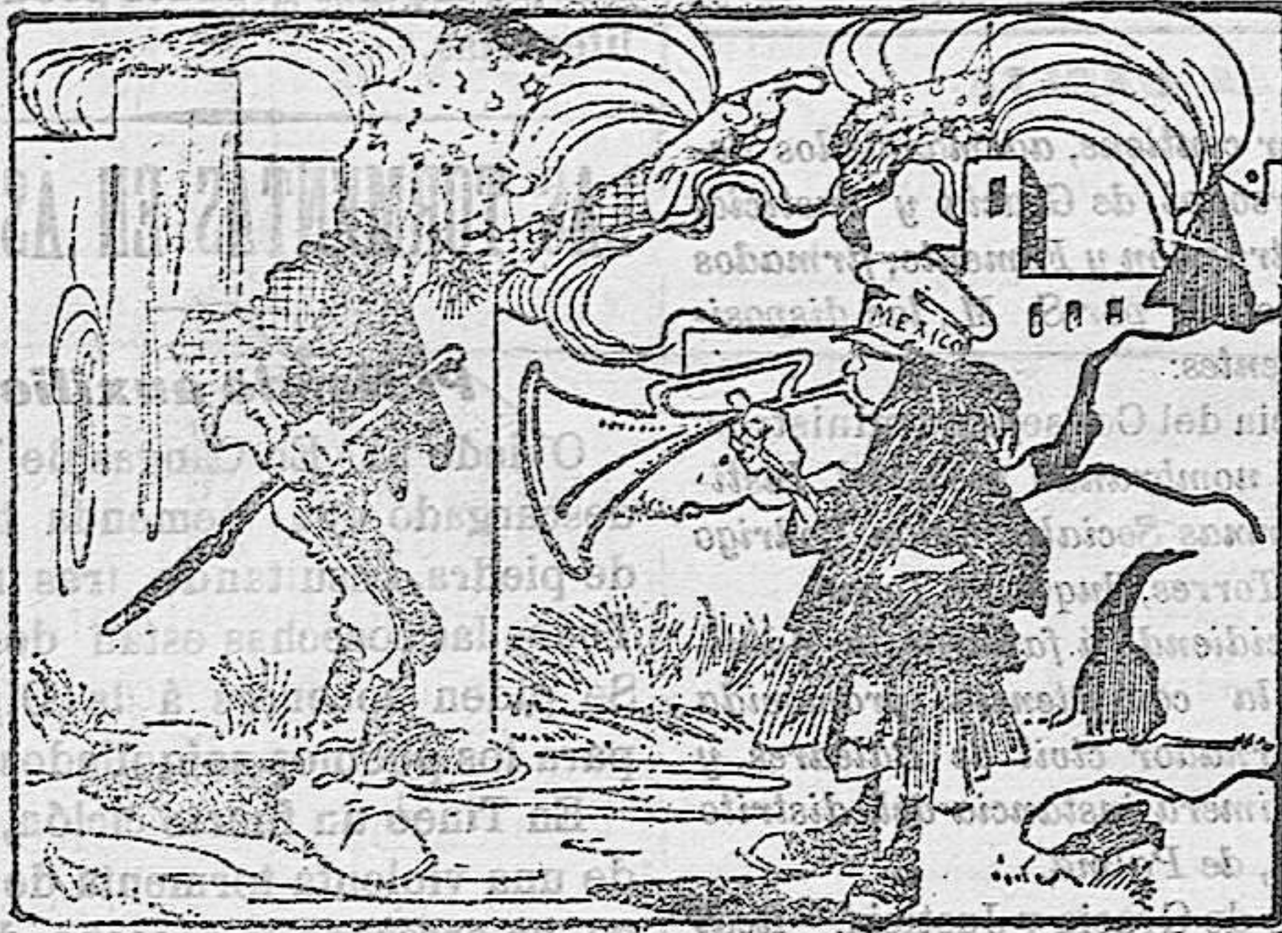
—Silencio, chiquillo, que el tío Sam es un mago... es un mago que le puede convertir en estrella de su bandera.