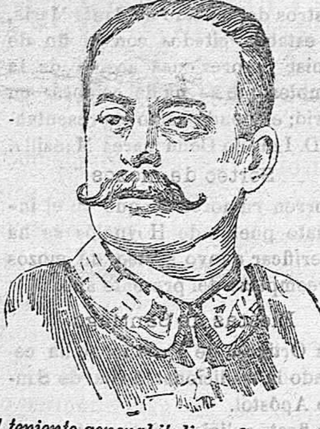
El teniente general italiano Spingardi.