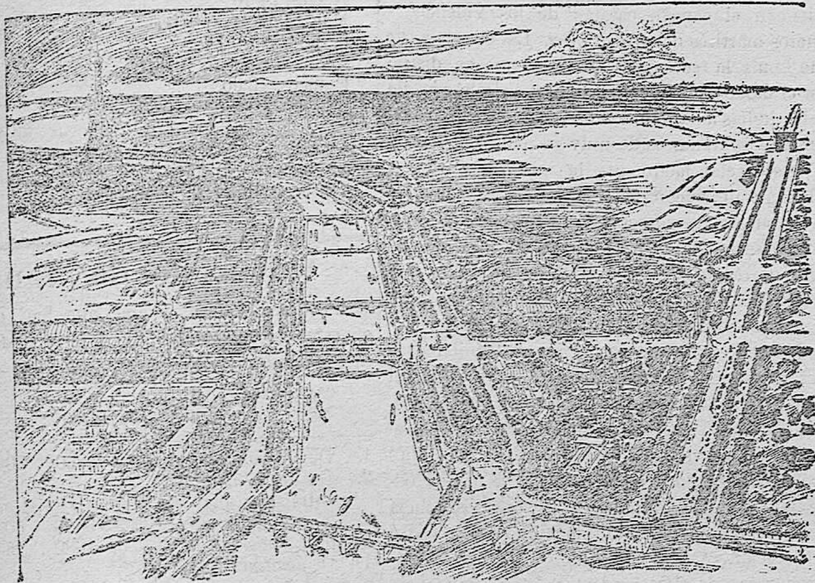
Panorama de la futura Exposición de Paris en 1900

Los franceses han ideado cerrar el siglo XIX con una Exposición a que convidan a todos los países del mundo, y que cubrirá con sus edificios y sus jardines una extensión vastísima en el corazón de París.