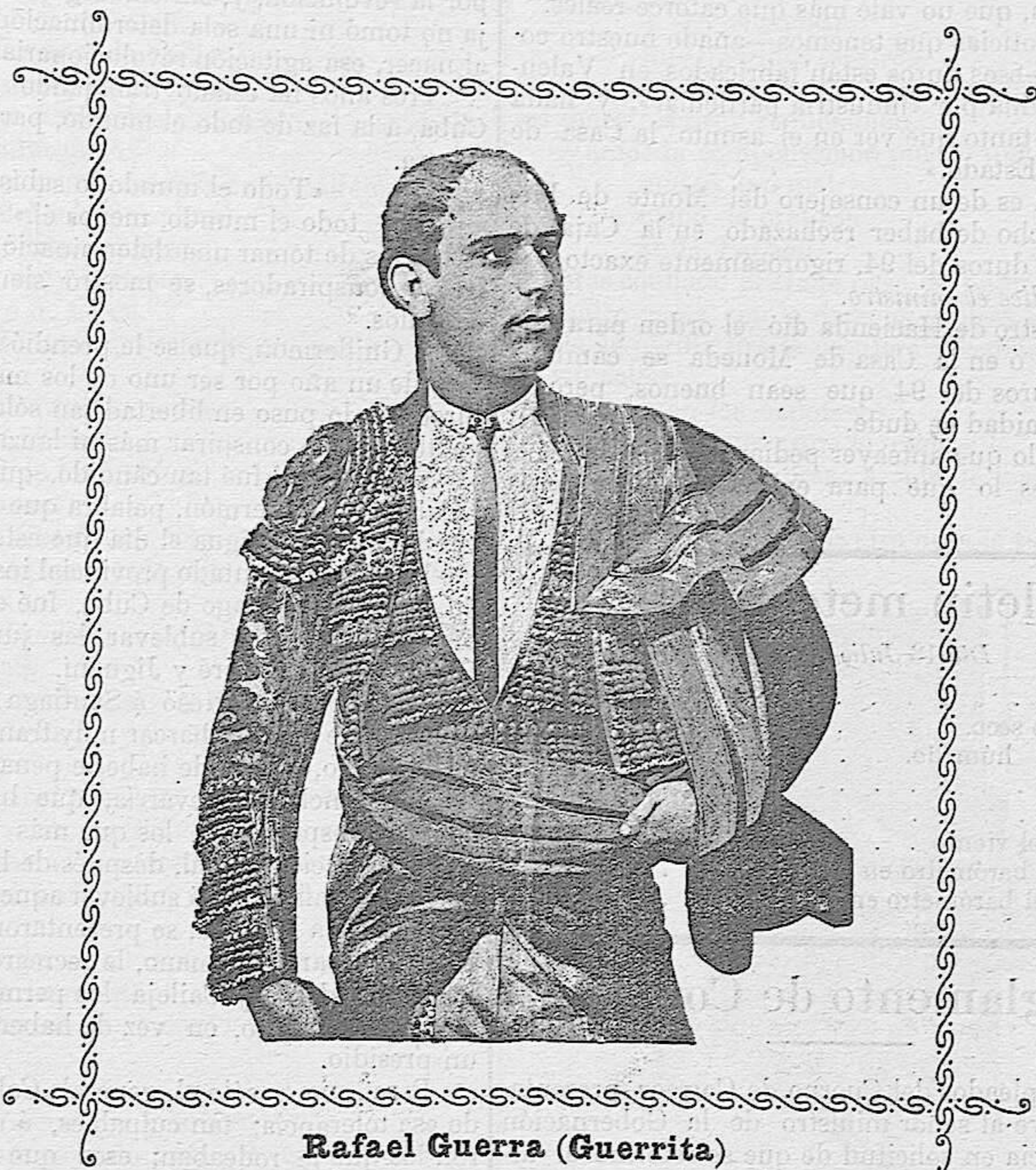
Rafael Guerra (Guerrita)

La gallardía de Rafael Molina sin llegar á su soberana elegancia; el arrojo de Salvador sin llegar