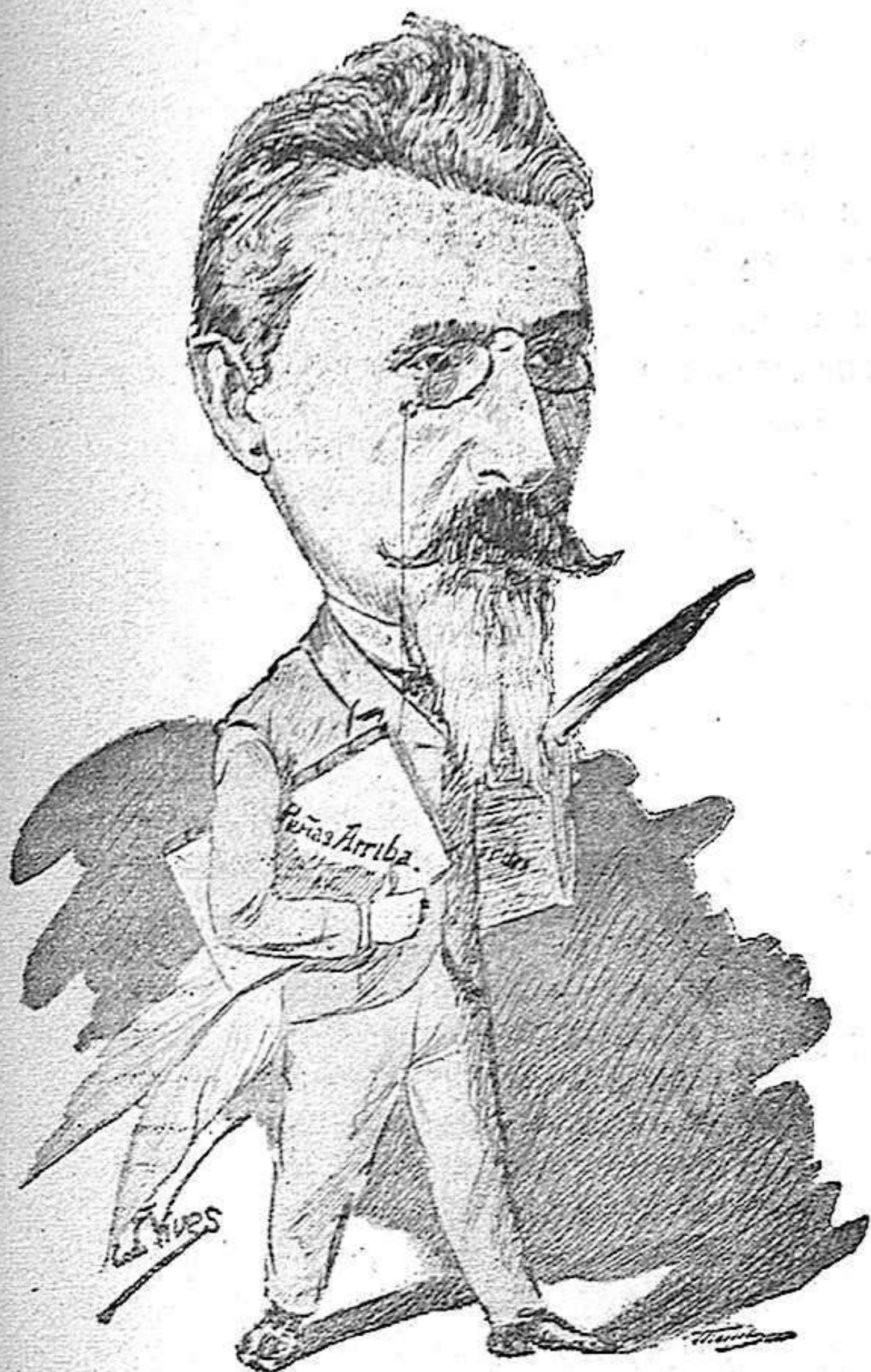
José M.ª Pereda