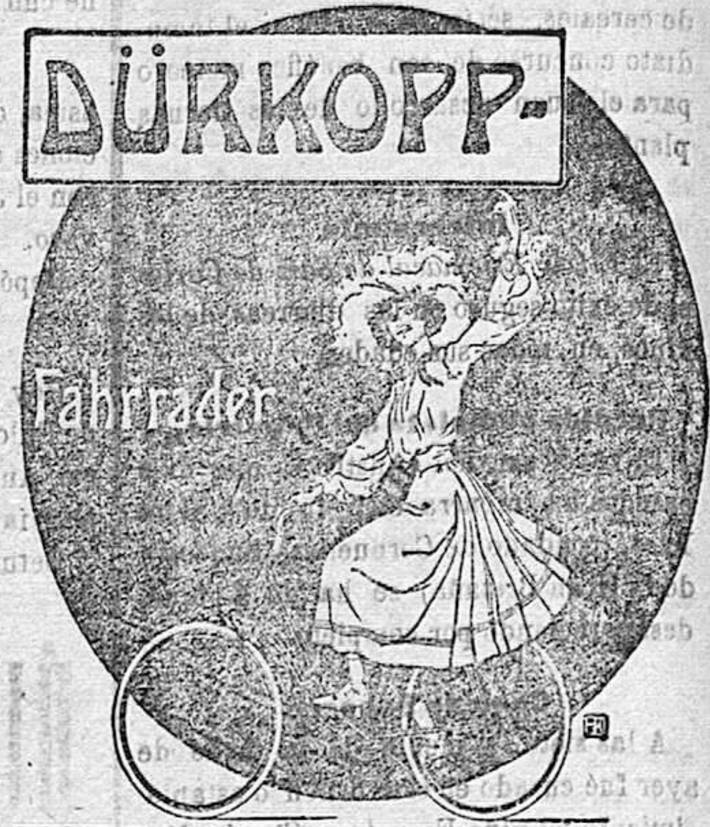
DURKOPP & C. A. G. BIELEFELD

Sublime adelanto en la construcción de los rozamientos de las bicicletas y motocicletas DURKOPP. Conseguída está por la casa Durkopp la más brillante de las victorias que hasta hoy se ha alcanzado. Un nuevo juego de pedalier Miami inventado por la casa DURKOPP ha resuelto por completo el más grandioso problema, dando lugar a que podamos garantizar que en este nuevo pedalier no hay desgastes, ni necesitan ajustes de ninguna clase, ni aun después de 20 años de uso. No hay que tocarlo jamás. Es, pues, sin duda alguna, el más brillante adelanto que se ha podido conquistar en rozamientos de bicicletas y motocicletas. Garantizamos asimismo la indestructibilidad de los modernos cuadros DURKOPP, contruidos por procedimientos modernos, por ser los más resistentes que se conocen. Garantizamos de igual modo la suavidad extraordinaria en los rozamientos de estos nuevos juegos, mediante los que se obtiene la más lisonjera marcha y la mayor facilidad para subir las cuestas. Infinidad de testimonios á disposición de mis favorecedores. Pídanse catálogos de Bicicletas, Motocicletas, Automóviles, y de accesorios en español mediante la remisión de franqueo á la