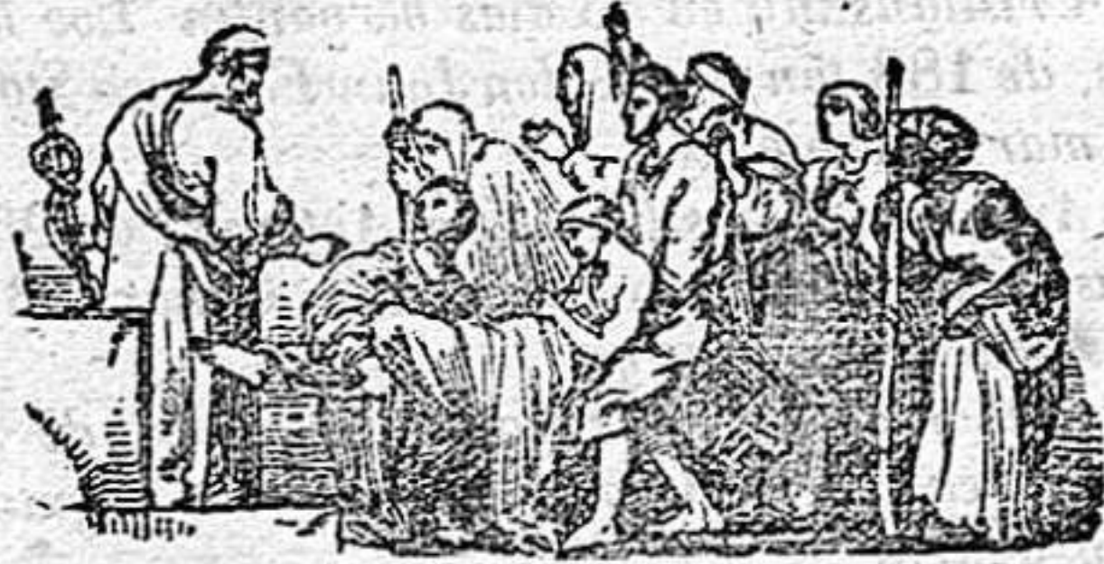
LAS PILDORAS HOLLOWAY.

Hay salvación hasta para los desahuciados.