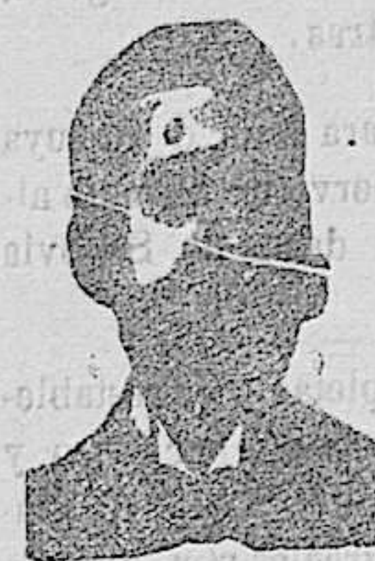
Alfredo Costanzi Diputación, 435, et.º Barc.º

Preparación la más racional para curar la tuberculosis, bronquitis, catarros crónicos, infecciones gripales, enfermedades consuntivas, inapetencia, debilidad general, postración nerviosa, neurastenia, impotencia, enfermedades mentales, caries, raquitismo, escretulismo, etc. Frasco 2'50 pesetas. Depósito: Farmacia del Doctor Benedicto, San Bernardo, 41, Madrid; y en Segovia: Farmacia y Droguería de Julio de la Torre Bartolomé, Juan Bravo, 47 y 63. En Cuéllar: Farmacia de viuda de Lozano, En Sangreña: Farmacia de Gómez García, y en Bilbao, Santander, Gijón y Vigo, la S. E. de Droguería General.