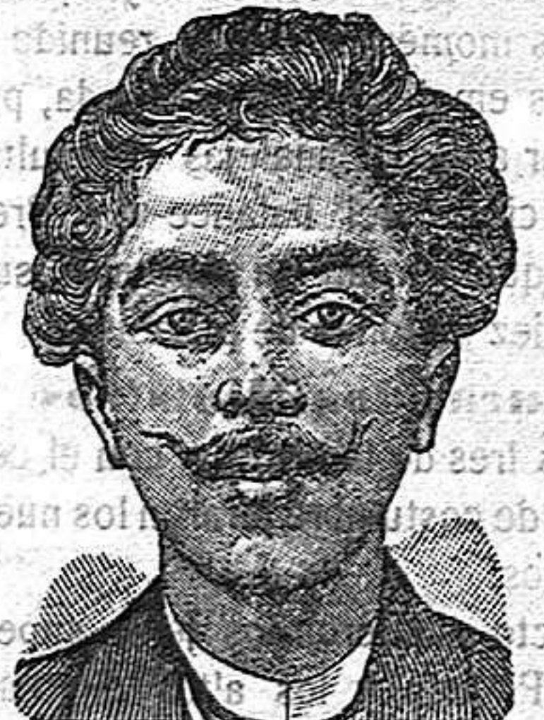
Antes de la curación 15 días después de tratamiento.