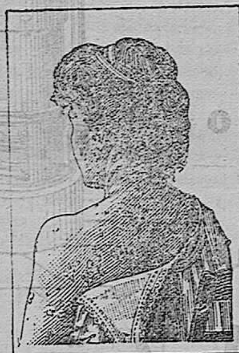
Antes de la curacion