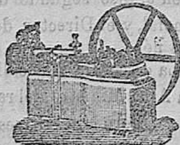
Máquina de vapor Horizontal.