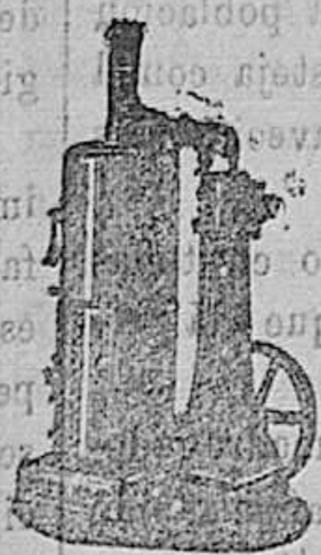
Maquinas de vapor, Bombas, Presnas, Tubos de todas clases