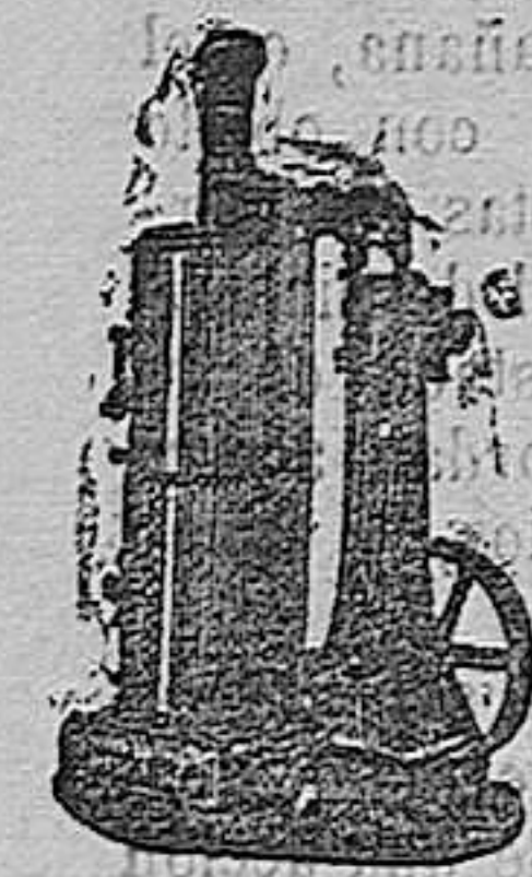
maquina de vapor vertical