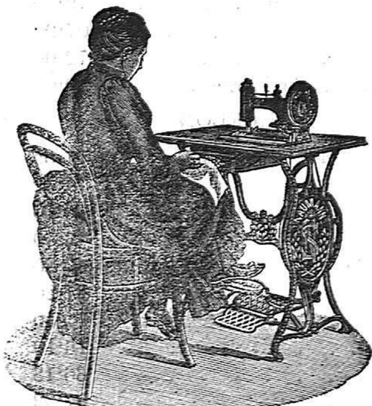
Nuevo, Práctico Higiénico