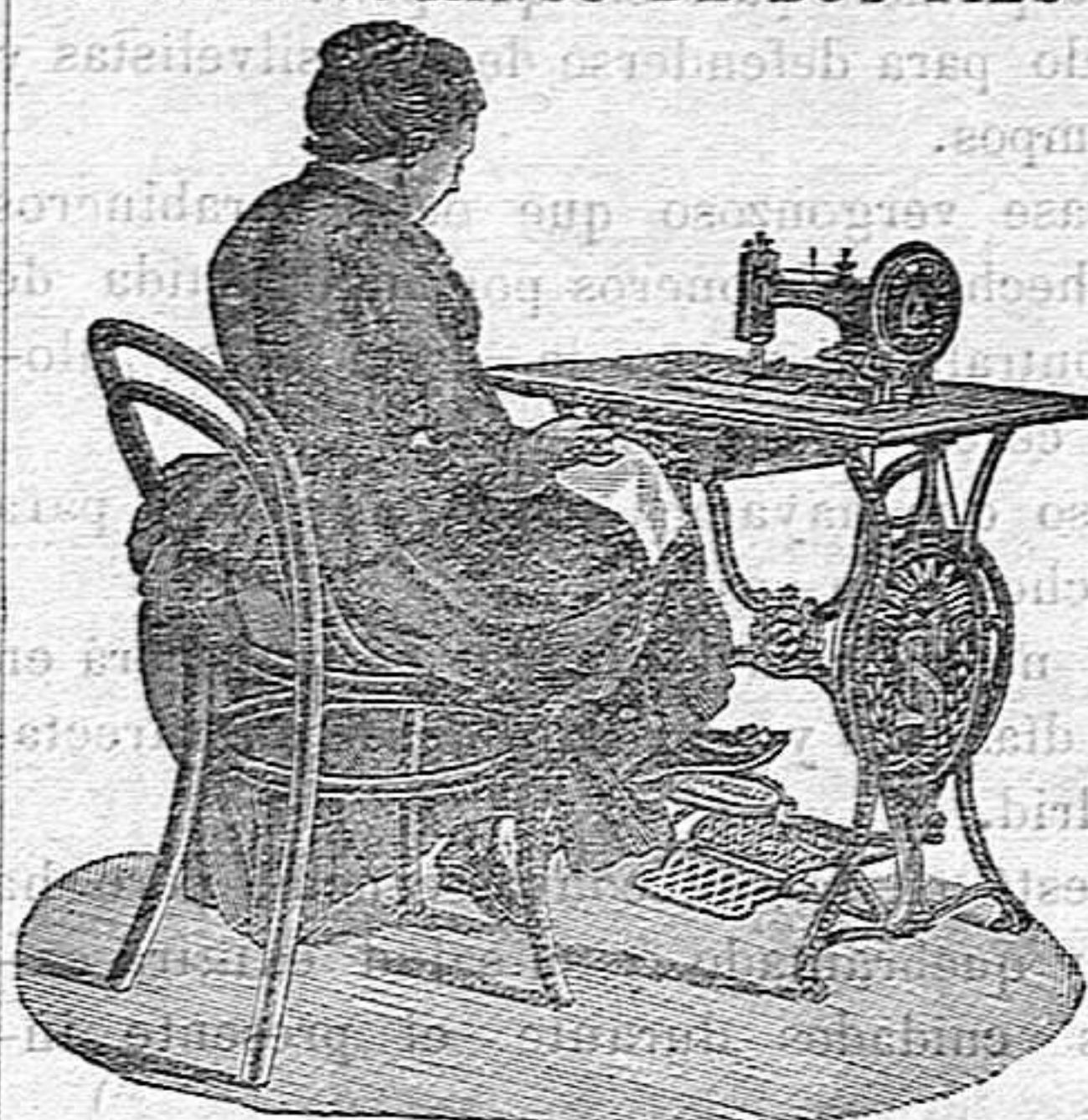
Nuevo, Práctico, Higiénico