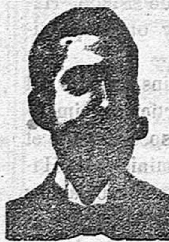
Angelo Costanzi Diputación, 435, et.º Barc.º

Los selectos gustos, el perfecto corte y la esmerada confección, unido á la economía en los precios, han hecho que este establecimiento sea el elegido por el público de la capital y su provincia.