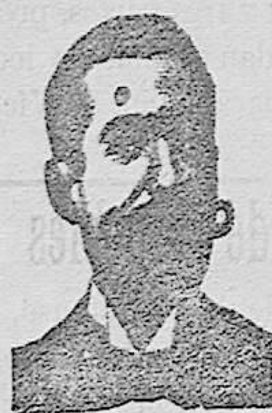
Salvati Costanzi Diputación, 435 Barcelona

PARIS, 8, rue Vivienne, y todas las Farmacias.