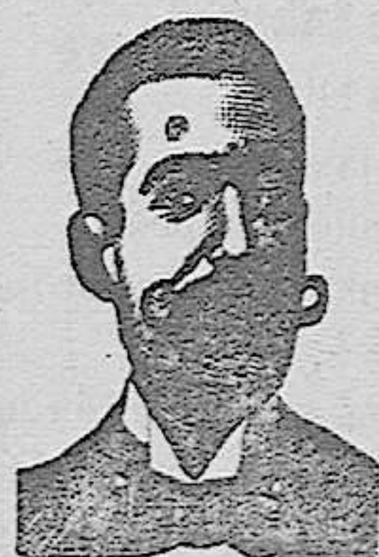
Salvati Costanzi Diputación, 435 Barcelona.

O INYECCION ANTI-VENEREOS —Y ROOB ANTISIFILITICO— Costanzi