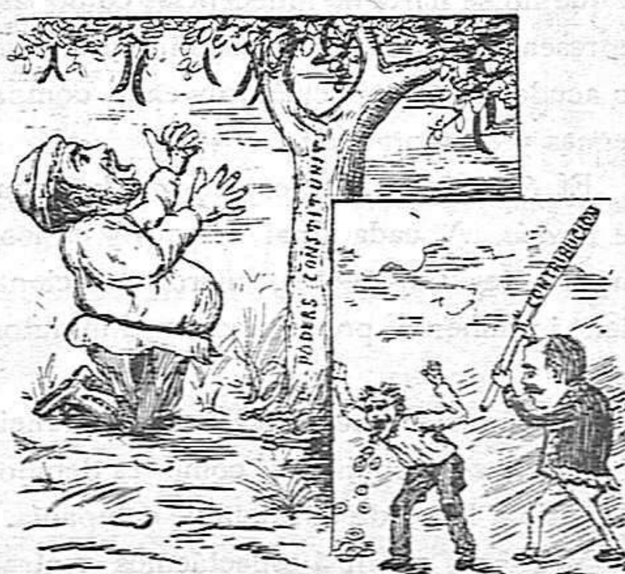
Treure dels uns pera engrexar als altres.