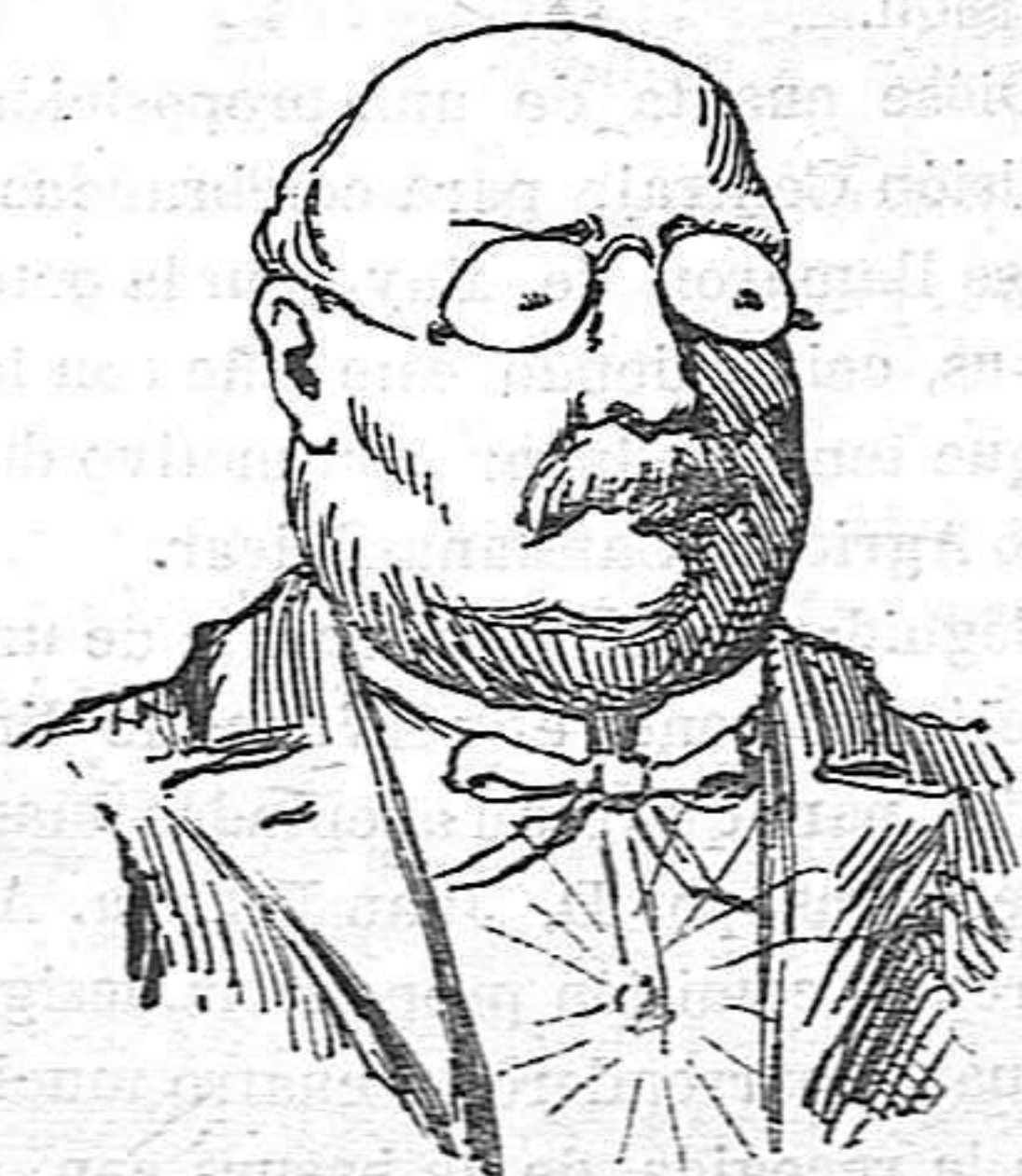
—Ja hi estaria be jo en una candidatura catòlich-liberal-conservadora.