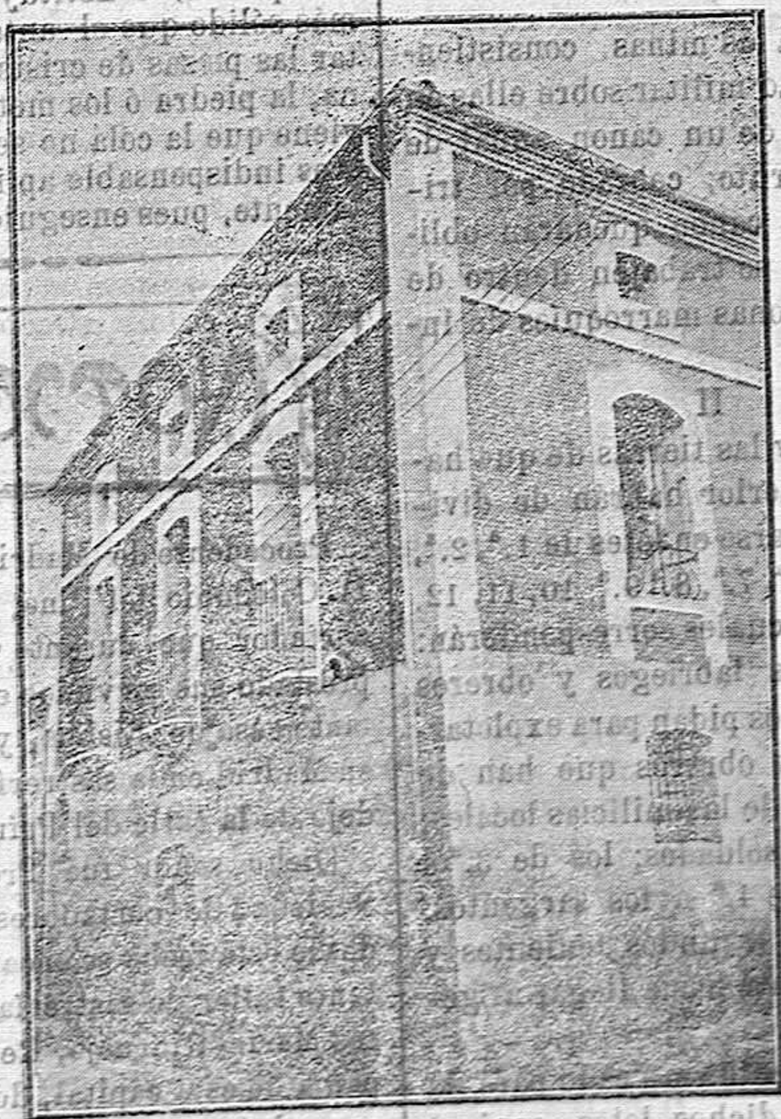
Edificio donde es instalado el Consultorio de Sr. Ruiz.

Vedrine, el famoso vencedor del «raid» París-Madrid, está en camino de ser el piloto aviador que monopoliza por completo la atención de los que siguen anhelantes y entusiastas los progresos que a fuerza de estudios y de bizarrías llevan un día y otro a su historia la navegación aérea. Esa afirmación respecto a Vedrine no parecerá exagerada a los que sigan con atención sus proezas desde que el «raid» mencionado le reveló al mundo sportivo como un aviador energético, dominador como pocos del pájaro mecánico, y sobre todo, intrépido, animoso. Un día bate el «record» del vuelo con pesajeros conduciendo en su aereo plano ocho personas; otro se eleva a más de dos mil metros de altura, hasta donde ningún otro piloto había osado elevarse; en esta gana el «record» de resistencia; avanzó el de velocidad acaso establecido por él. Su última hazaña le ha hecho dueño del «record» mundial de velocidad. Tripulando su monoplano ha recorrido en una hora 164 kilómetros, lo que demuestra una energía y una resistencia verdaderamente increíbles. Mantener durante algunos minutos velocidades de 150 kilómetros y aun superiores era proeza repetida por va-