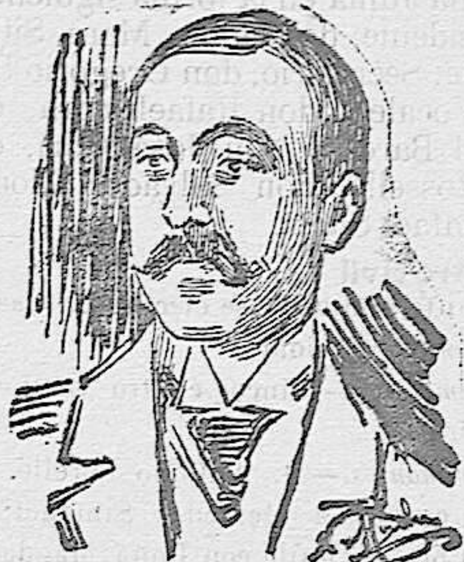
Sir Charles Thomson Ritchie

Ninguna TOS resiste 24 horas a los Discooides pectorales Roselló. Caja 2 reales.—Depósito: Sociedad Farmacéutica Industrial, Lugo.—Venta en todas las farmacias.