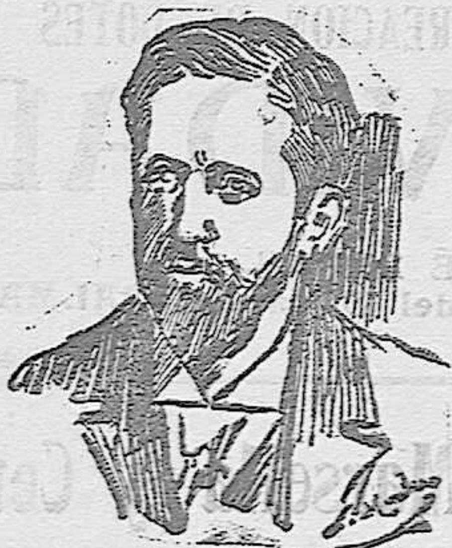
Lord George Hamilton

Ultimamente las dimisiones se han extendido a Lord Balfour de Burlergh, secretario de Escocia y Mr. Arthur Elliot secretario del tesoro y aun es posible que siga la desorganización del gabinete.