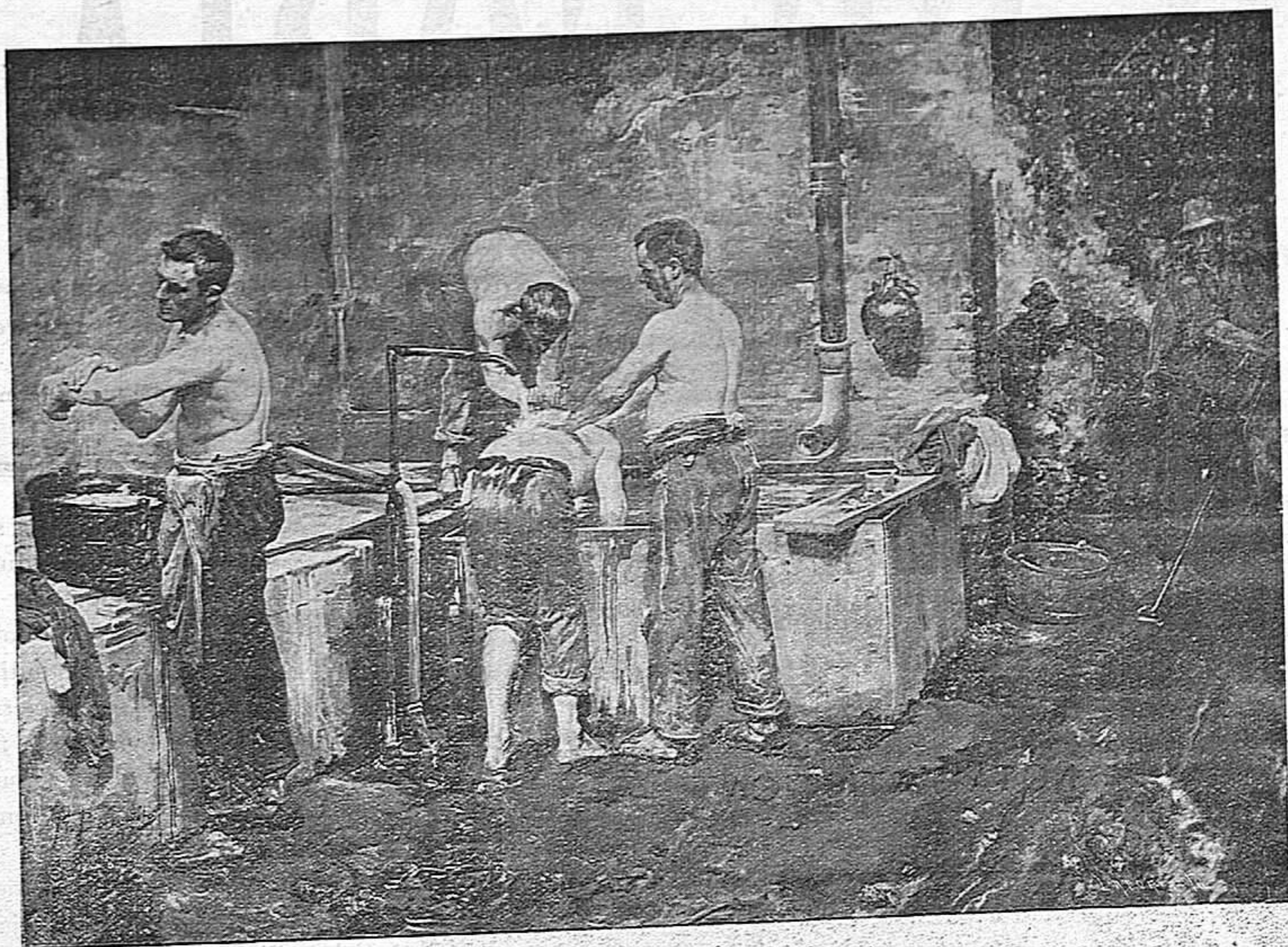
EL ASEO DESPUÉS DEL TRABAJO (Cuadro de M. Benedito).