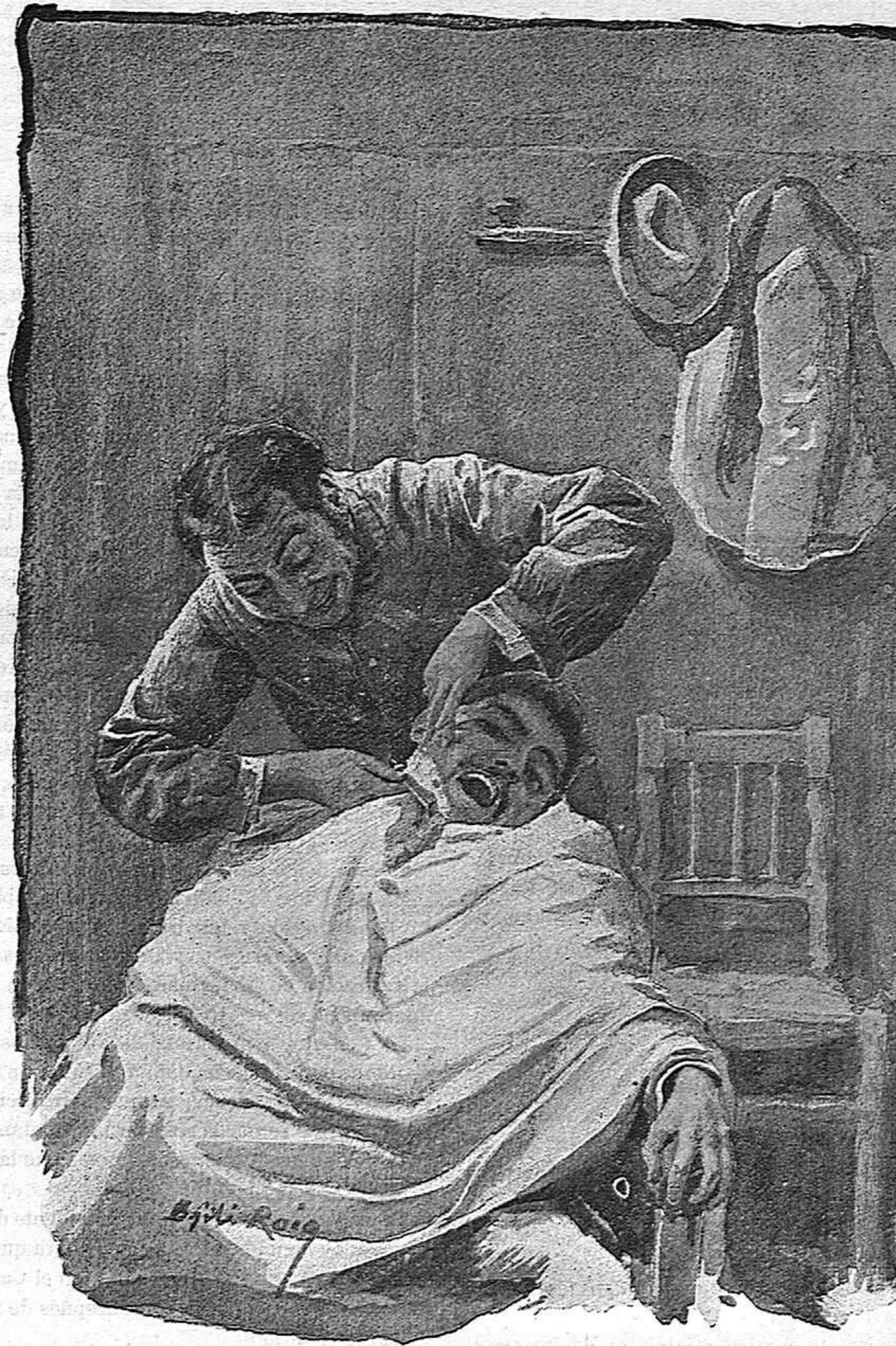
EL RAPABARBAŞ (Dibujo de Gili Roig).

mos corolario obligado de la autonomía colonial, es la supresión para en lo sucesivo del cupo forzoso de Ultramar, terror de las familias, que con razón creen condenados á muerte inevitable á los seres queridos á quienes cabe la triste suerte de servir en las filas del ejército ultramarino.