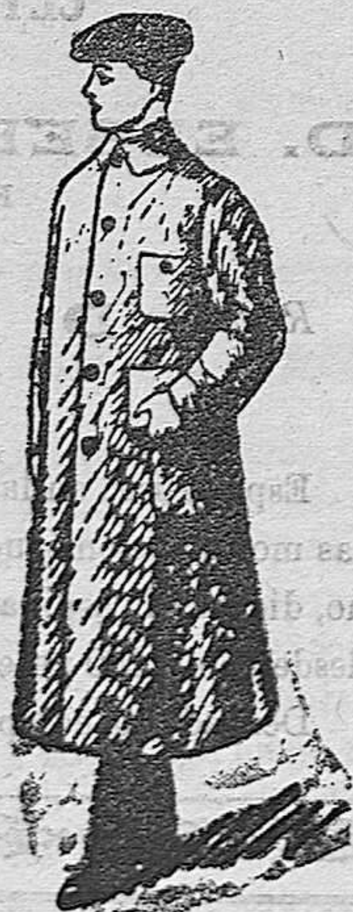
Guarda polvos caballero, a 12, 15, 18, 20, 25 y 30 pesetas