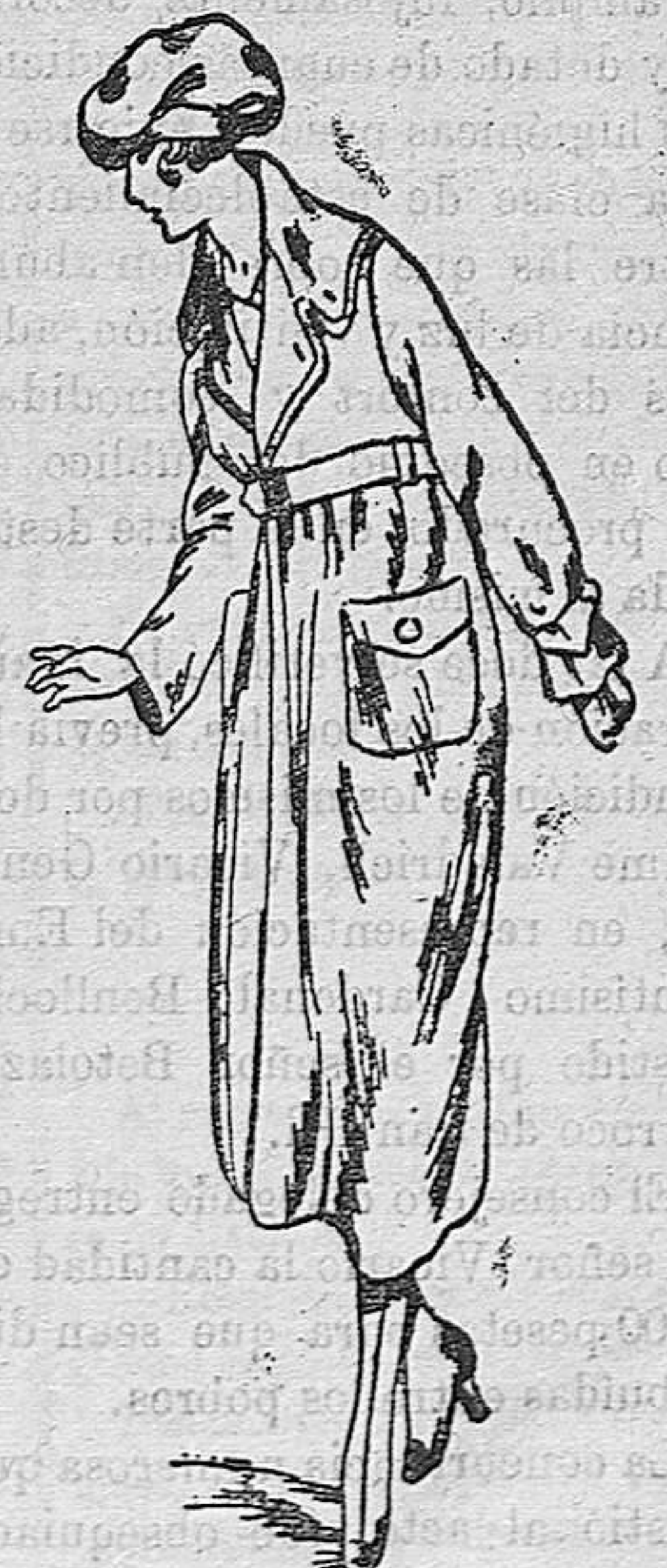
Abrigos paño de señora, a 25, 30, 35, 40 y 50 pesetas. Abrigos de niña desde 15 pesetas a 60.