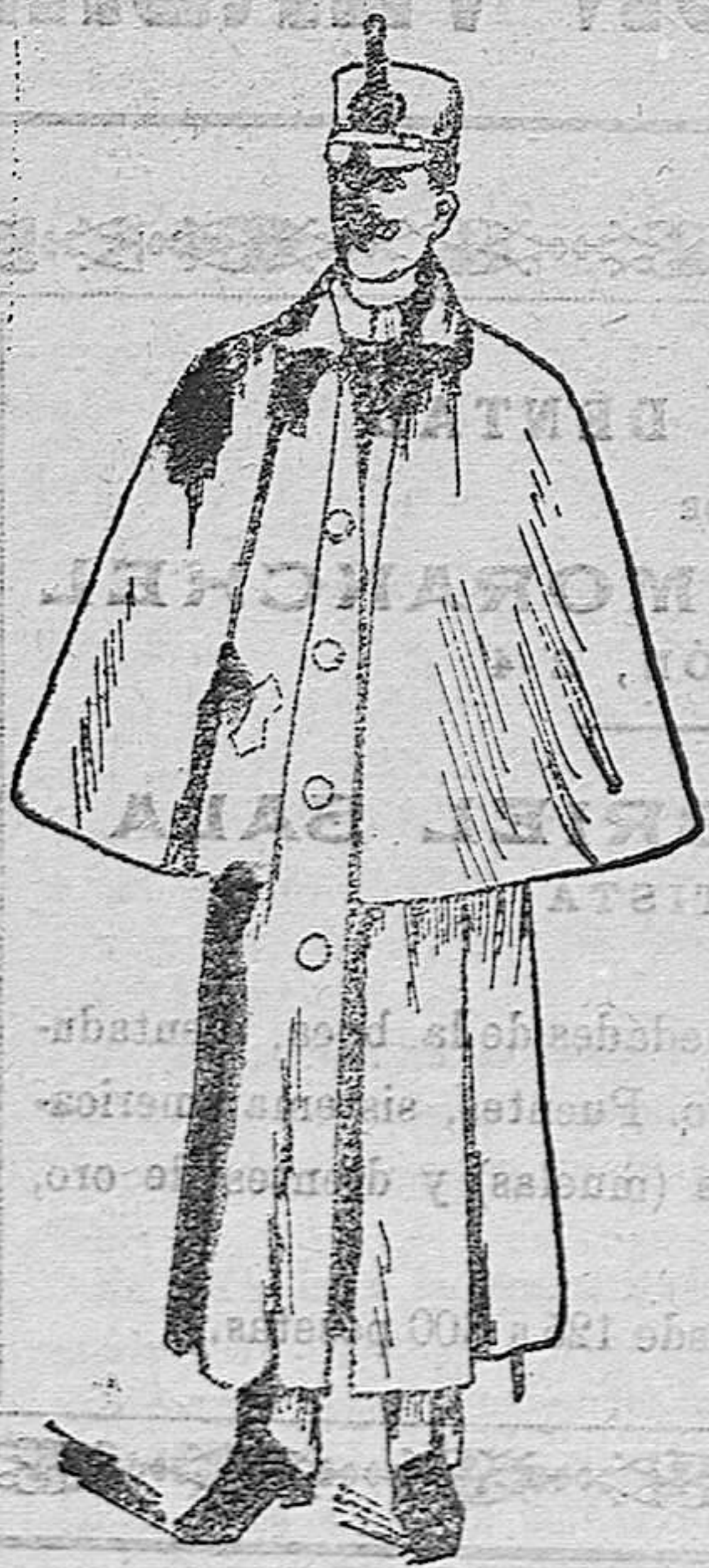
Impermeables en negro y azul con esclavina a 120, 130, 140 y 150 pesetas. Sin esclavina en negro, azul y colores a 50, 70, 80, 90, 100 y 150 pesetas.

Primera casa en confecciones de caballero, señora, jóvenes, niños y niñas