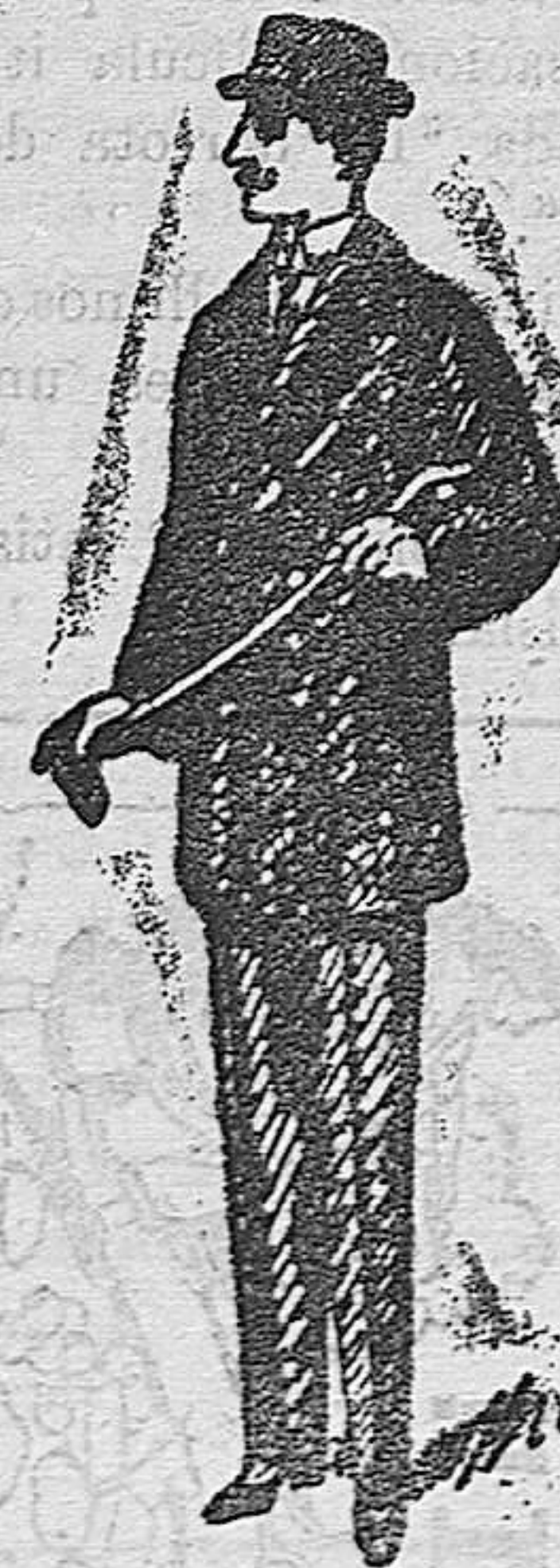
Pellicas de paño castor, rizo en el cuello y mangas, a 20, 25, 30, 40, 50, 60, 70 y 100 pesetas