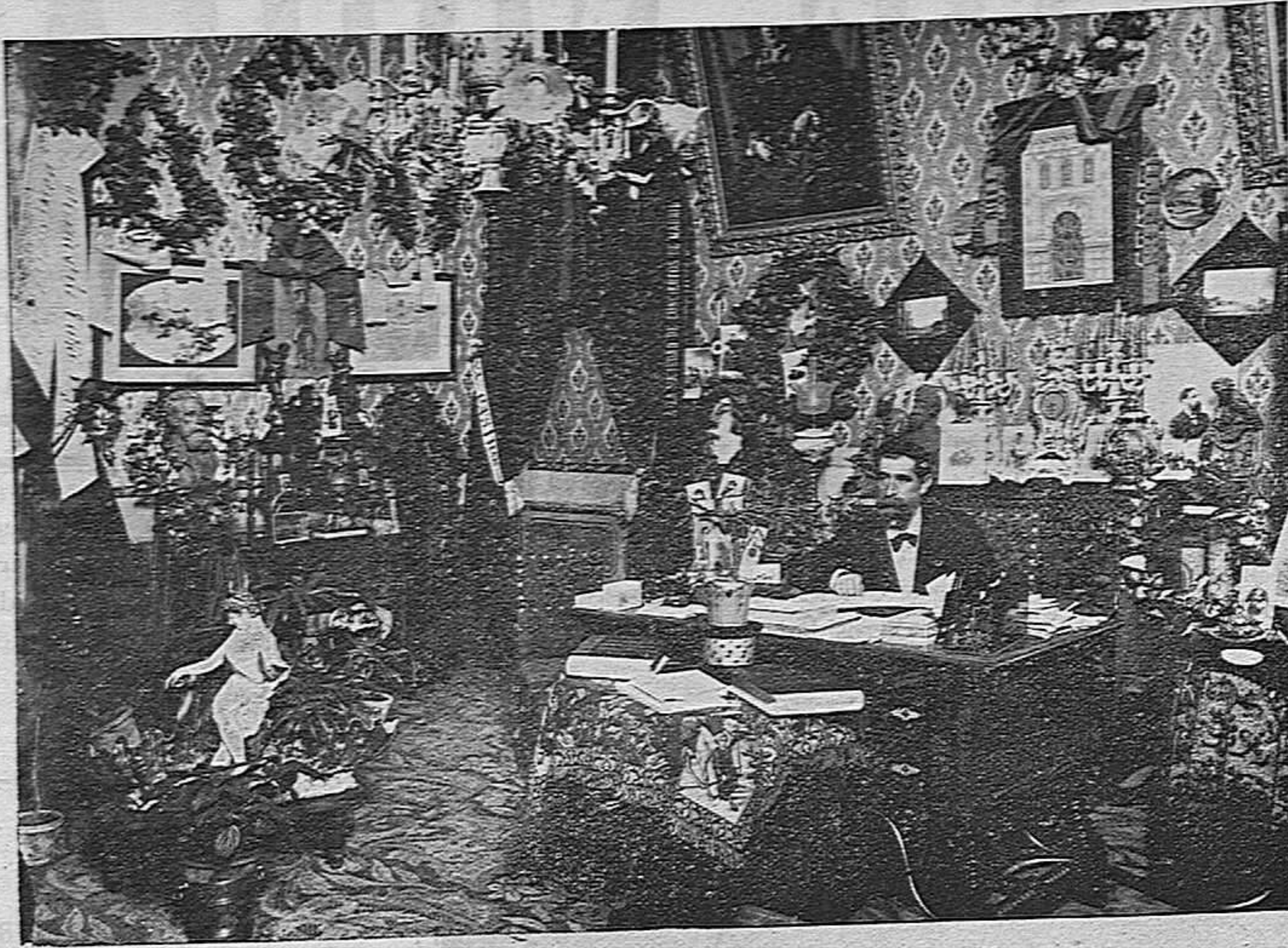
El maestro Bretón en su estudio.