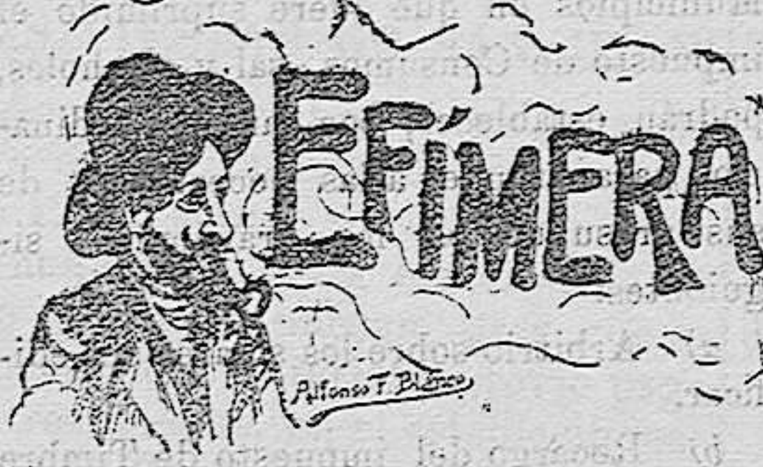
Los consumos y las chapas