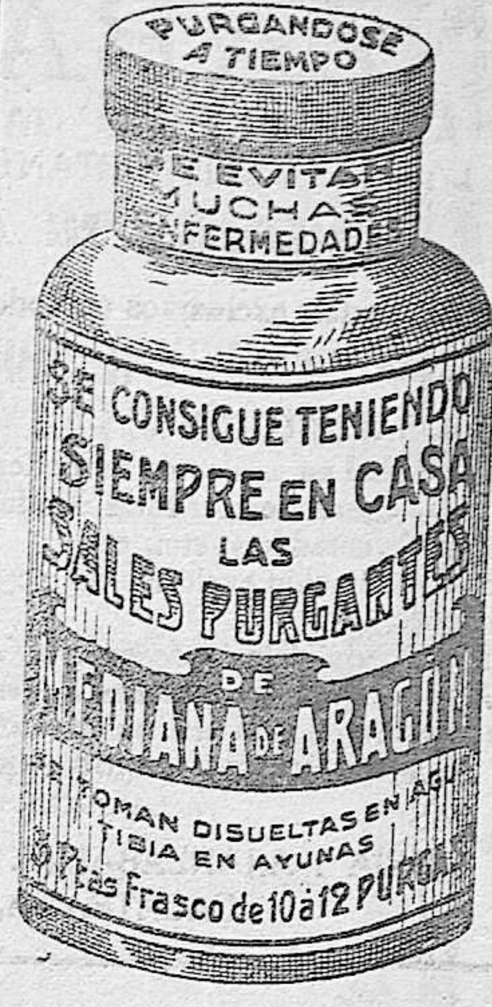
Imp. de Fermín Corral.—C. Real.

Comedores, alcobas, despachos, clasificadores, bureaux, librerías, camas con sommier, 37,50; camas, 50; matrimonio, 65; camas curas, 50; colchones persona, 15; cameros, 25; matrimonio, 35; armarios, 110; cómodas, 70; mesas comedor, 22,50; percheros, 22,50; sillas, 6,50; mesillas noche, 18,50. Ocasión: camas doradas, máquinas Singer modernas, espejos, lavabos completos, 30; alhajas, ropas, objetos. Almacenes: Estrella, 10; Lana, 23, MATESANZ.