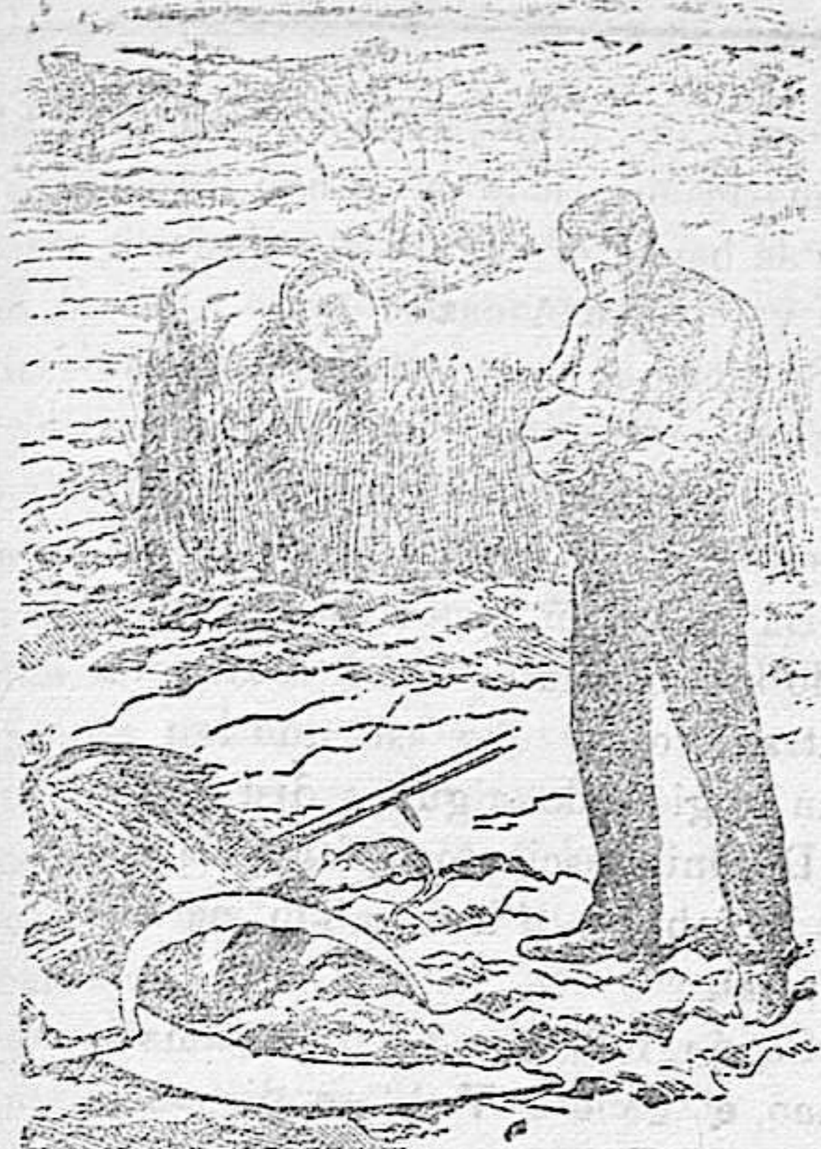
Agricultor rutinario que no lee