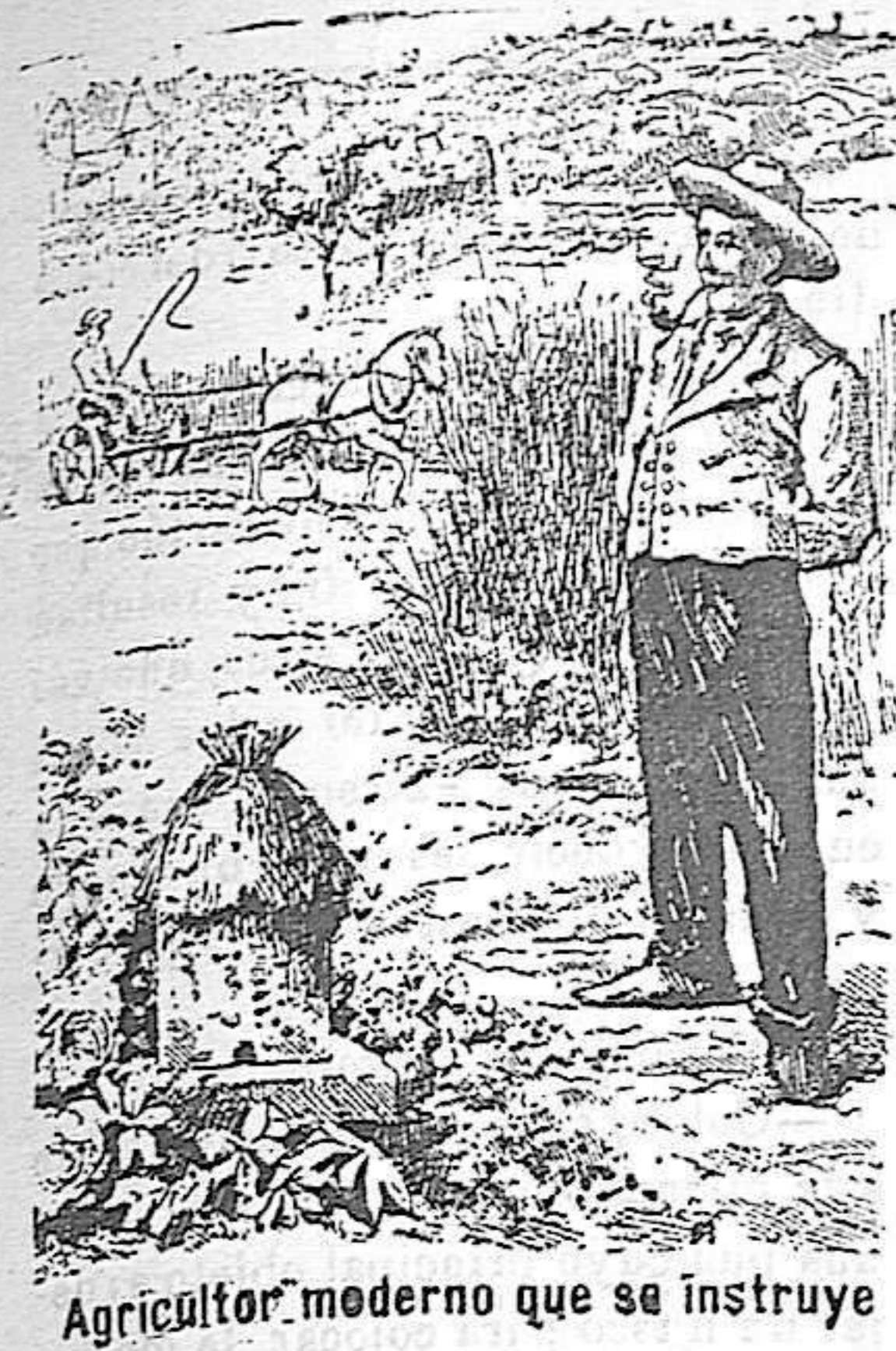
Agricultor moderno que se instruye