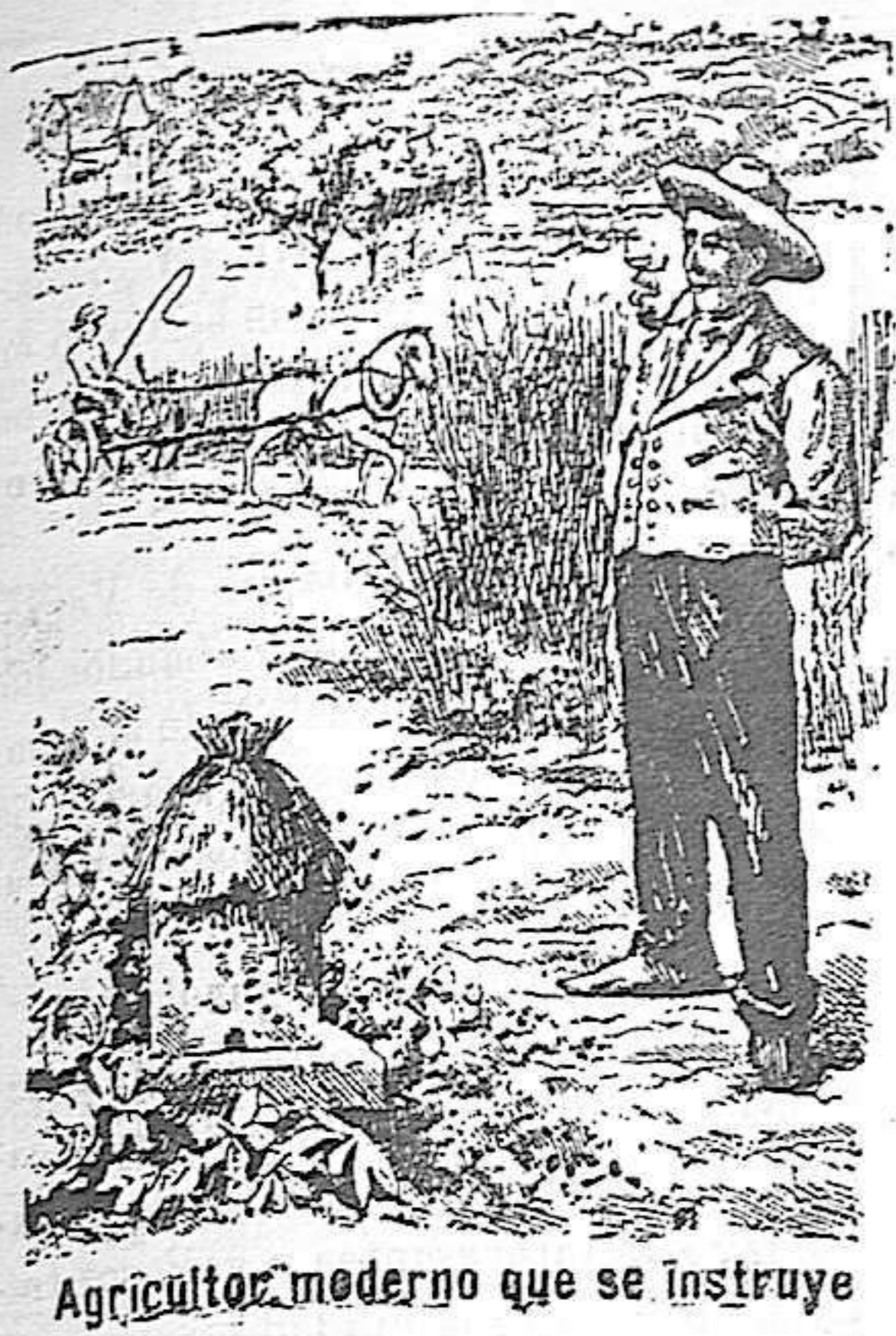
Agricultor moderno que se instruye