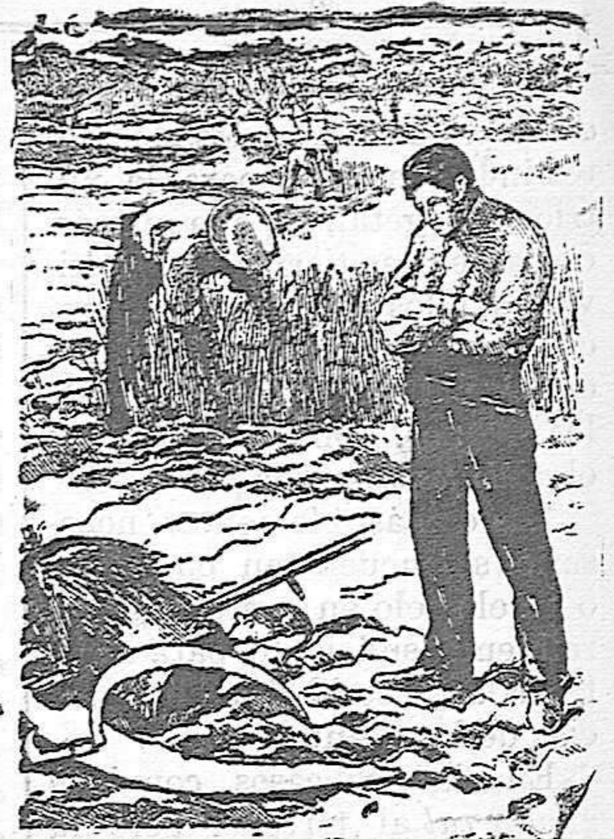
Agricultor rutinario que no lee